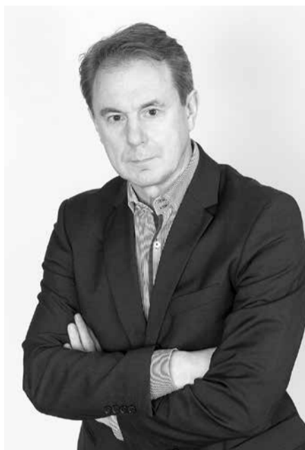
tais VARAM 2. februāra dokuments man tā arī nav izsniegts joprojām!

Ko jūs! Protams, ka nē! Pirms mēneša ar neslēptu ironiju pasmejot, sakot, ka interesantākais tikai tagad sākas! Padomājiet, cik ūdens aiztecējis kopš februāra sākuma. Ir marta vidus. Manai rūgtajai ironijai bija pamats. Vēlreiz publiski apliecinu, ka arī minē-