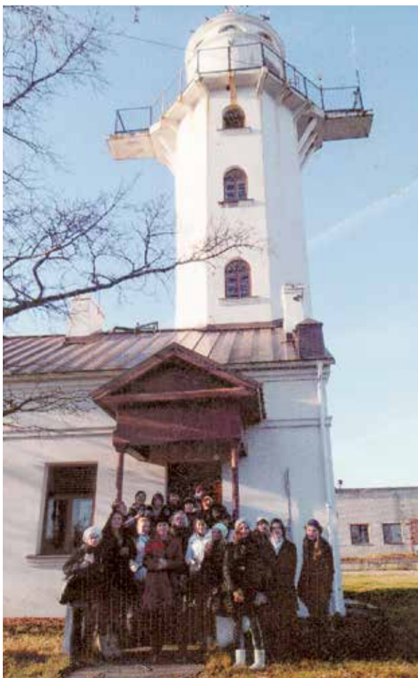
Старую лоцманскую башню на полуострове охотно посещают школьники.

«Здесь интересно, к тому же своей работой и в прямом смысле и косвенно мы чувствуем свою причастность как к жизни порта, так и к жизни всего города. С происходящим в порту фактически связан каждый третий или четвёртый вентспилчанин. Смотри с нашего полуострова, тому подтверждением являются почти непрерывно входящие в порт океанские лайнеры, рыболовецкие тральщики и яхты, военные корабли Латвии и стран НАТО, рефулёры, лоцманские катера и другие плавсредства, которые бороздят воды Венты и аванпорта», хотя плавучие объекты информацию о возможности движения