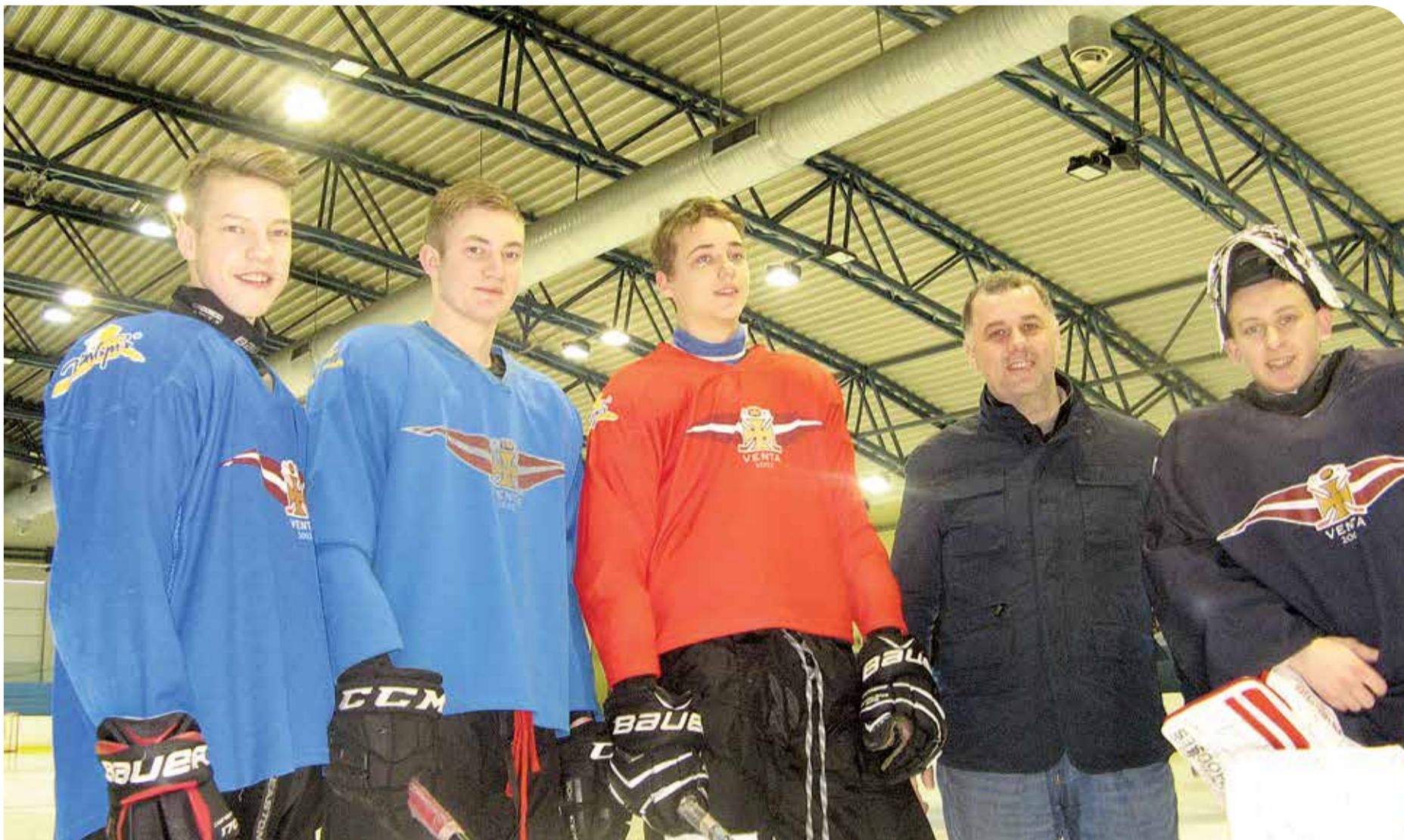
U-14, U-16, U-18 un 1.līgas komandu izveide, sporta internāta nodrošināšana nebūtu bijusi iespējama bez AS "VENTBUNKERS", AS "KĀLIJA PARKS", AS "BALTIJAS ESPRESIS", SIA "VENTSPILS NAFTA TERMINĀLS" palīdzības.