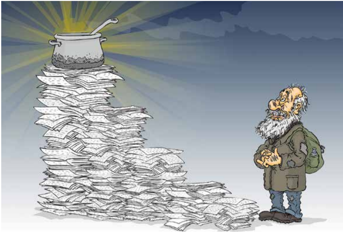
Рисунок – Zengius