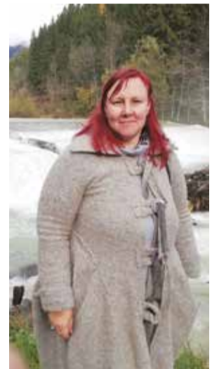
В свободное от выставки время в горах Словении.