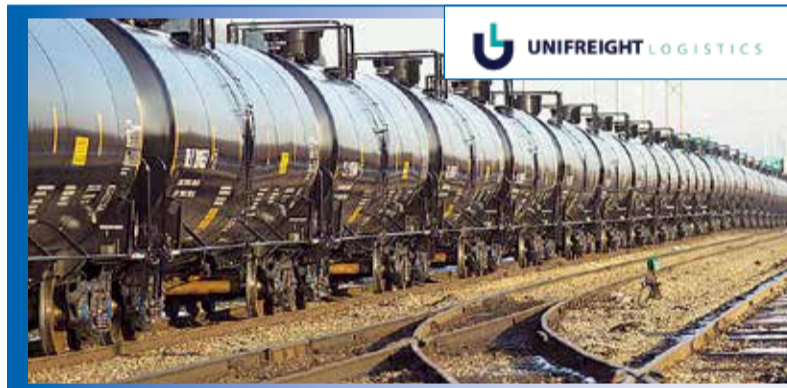
АО «Unifreight Logistics» в 2018 году в бюджет Вентспилсского самоуправления в виде подоходного налога с населения заплатило 44 371 евро.