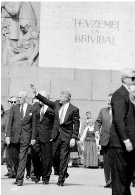
Jura fotoobjektīvs tvēris arī ASV prezidenta Bila Klintonu vizīti Rīgā.