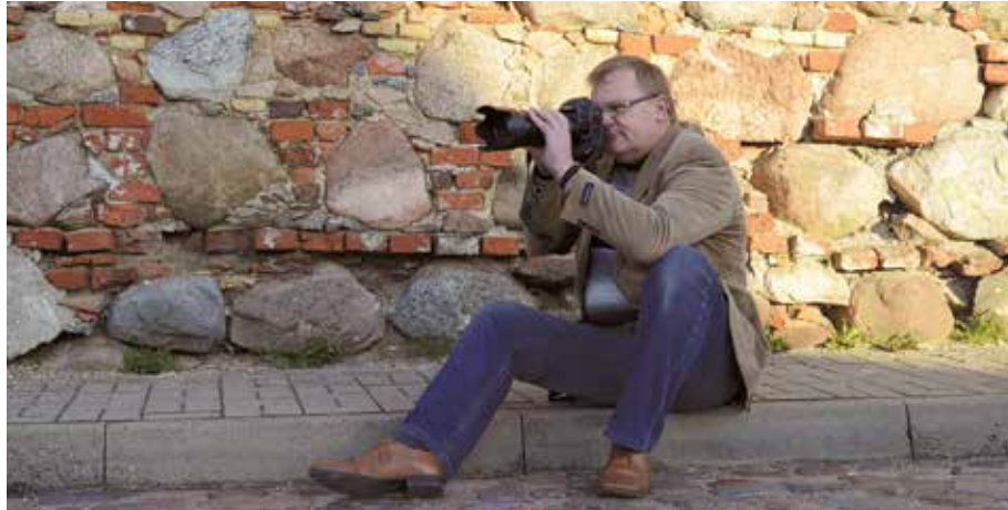
Kaut kad darbā Ventspils Tīrgus laukumā.

"Arī tajos gados fotogrāfu paša un draugu priekam, pat fotopulciņa nodarbības apmeklējumi, kamēr tā vadītājs nebija nodzēries... Bet kāpēc viss iepriekšējais stāsts? Teikšu patētiski, bet patiesi – tikai iepazīšam dzīves skarbākās izpausmes un pieredzējušam cilvēku savstarpējo attiecību raibumu, pietika dūšas uzņemties fotokorespondenta darbu vietējā laikrakstā. Dažādu apstākļu dēļ šis posms ir noslēdzies, bet atskatā varu teikt – tas bija