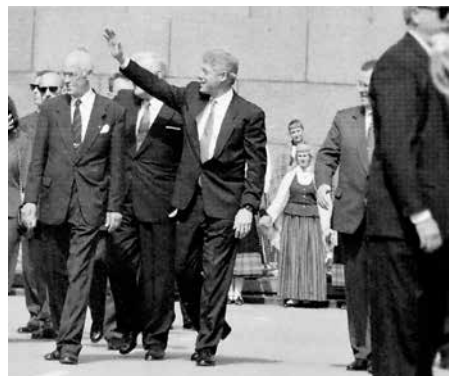
Фотообъектив Юриса запечатлел и визит президента США Билла Клинтона в Ригу.