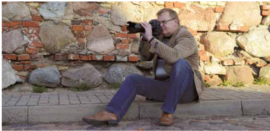
Когда-то на работе на Рыночной площади в Вентспилсе.

«И в те годы я фотографировал для себя и на радость друзьям, даже посещал занятия в фотокружке, пока его руководитель не спился... Но для чего весь предыдущий рассказ? Скажу патетически, но как оно есть – у человека, который только что познакомился с проявлениями суровой жизненной действительности и пестротой взаимоотношений людей, хватило смелости начать работу фотокорреспондентом в местной газете. По разным причинам этот этап завершился,