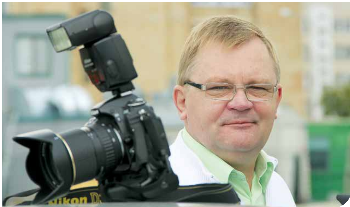
Небольшая передышка перед следующей съёмкой.

оказались в Пыталовском округе, в западной части бывшей Российской империи, который после Первой мировой войны как Яунлагале (позднее Абрене) стал территорией Латвии.