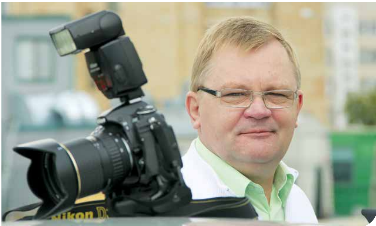
leelpa pirms traukšanās uz nākamo bildešanu.