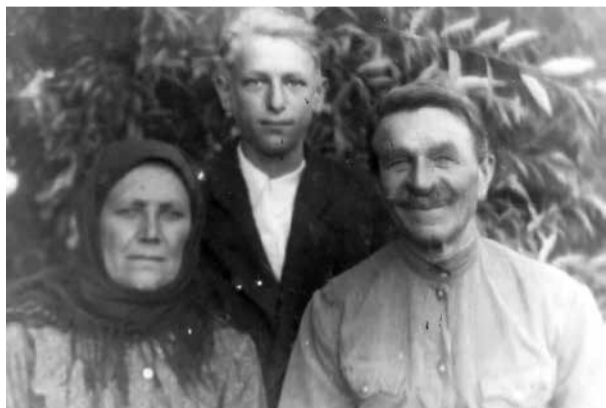
Бабушка и дедушка Елены и брат отца на Украине, примерно девяносто лет назад.

«Я поняла, что вокруг этой чувствительной темы ещё будут кипеть страсти, радикально настроенные политики будут