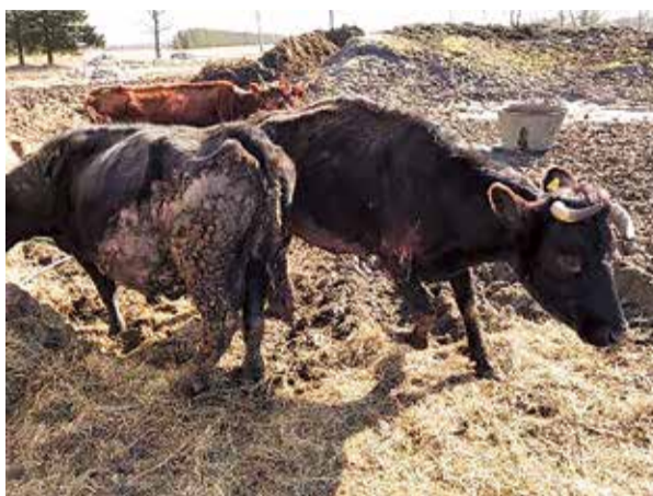
PVD inspektori janvāra pašā izskaņā izņēma 23 novārdzinātus dzīvniekus no kādas saimniecības Piltenes pagastā. Izņemto mājlopu vidū bija 18 liellopi, viens zirgs, divas kazas, āzis un arī

Dienestā informēja, ka saimniecībā izņemtie dzīvnieki ir nogādāti speciālā novietnē, ar kuru Nodrošinājuma valsts aģentūrai ir līgums par administratīvās lietas ietvaros izņemto dzīvnieku izmitināšanu. Tāpat ir uzsākta arī lietvedība administratīvā pārkāpuma lietā. PVD par konstatēto ir informējis arī Valsts policiju, līdz ar to saimnieci, kuras īpašumā ir šie nelaimīgie mājlopi, gaida lielas nepatikšanas un naudas sods.