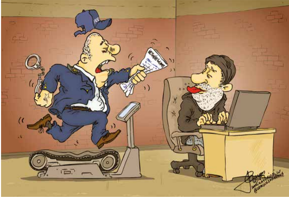
Рисунок – Zemgus

НОВОСТЬ ПРЕССЫ. В этом году получено несколько заявлений от жителей, которые желали приобрести сельскохозяйственную технику при посредничестве порталов объявлений, но стали жертвами мошенничества, проинформировали в Государственной полиции. В Курземе зафиксировано три таких случая. Подобным образом мошенники орудуют, продавая легковые автомашины. Мошенники размещают фотографии техники и описание технических характеристик на соответствующих порталах, предлагая приобрести технику по выгодной цене. Затем поддерживают связь с заинтересовавшимся покупателем по телефону или посредством электронной почты. Коммуникация происходит до того момента, когда мошенники отправляют потенциальному клиенту подготовленный счет для осуществления первого взноса, чтобы организовать дальнейшую продажу товара. В тот момент, когда деньги внесены, коммуникация прекращается. Подобные объявления помещают и мошенники, которые выдают себя за работников уже существующей и известной фирмы, а также используют электронные адреса дилеров похожих конкретных фирм. Для того чтобы не попасться на удочку подобных мошенников, потенциальным покупателям нужно хорошенько проверить, как написано название фирмы и электронный адрес работника фирмы. Чаще всего используются похожие названия, изменяется лишь одна буква или варьируются знаки препинания в адресе электронной почты.