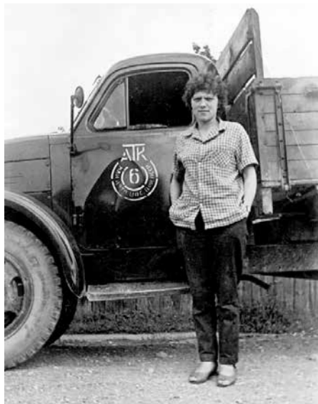
Парсла в начале шофёрского пути на Вентспилской 6-й автобазе.

После ссылки он работал в ремонтно-строительном управлении, был даже на «доске почета» в Риге. Затем его уговорили перейти