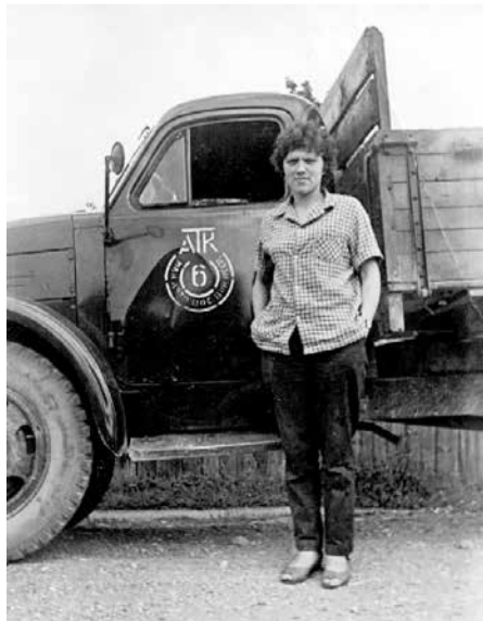
Pārsļa šofera gaitu sākumā Ventspils 6. autobāzē.

Viņam mūžs pēc izsūtījuma pagājis, strādānot Remontu un celtniecības pārvaldē, bijis pat uz nozares “godā dēļa” Rīgā. Pēc tam pierunāts pāriet uz pašvaldības uzņēmumu “Siltums”, no turienes izvadīts pelnītā atpūta. Tā gan joprojām esot visai nosacīta – darāmā pie mājas un dārzā tik daudz, ka visu nevar paspēt, jo arī spēks iet mazumā. Pārslai