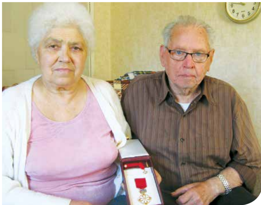
Радость по поводу полученной награды разделит с супругой Парслою.