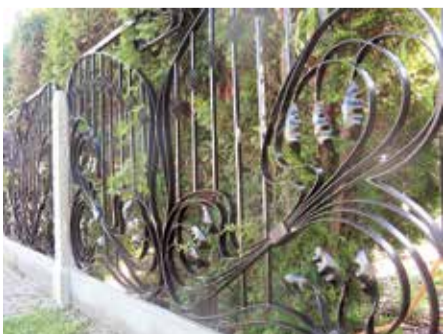
Забор, выкованный Айнаром для одного из домов в Вентспилсе.