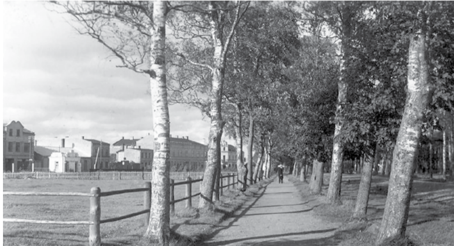
20. gs. 20. gadu sākuma foto. Kreisajā pusē žoga apņemtais aploks, kur ap 1909.–1911. gg. atradās Goreca cirks.

Vai patiesi mūsu pilsētā reiz pastāvējuši trīs īsti, pastāvīgi darbojošies cirki? Taisnība, gan ne vienlaicīgi, bet cits pēc cita. Taču tā reiz bija – tālajā 20. gadsimta sākumā, kad vēl nebija ne radio, ne televīzijas, bet elektriskā apgaismošana šķita brīnumam līdzīga. Taču būtu visnotaļ aplami domāt, ka tamdēļ cilvēki bijuši primitīvi vai atpalikuši ļautiņi. Salīdzinot ar mūsdienām, tālaika ventspilnieki bija krietni sabiedriskāki un daudz laika pavadīja ārpus mājas, apmeklējot visdažādākos sarīkojumus un sanāksmes ar „saviesīgu dzīvi”, teātra izrādes, koncertus, tostarp arī cirku.