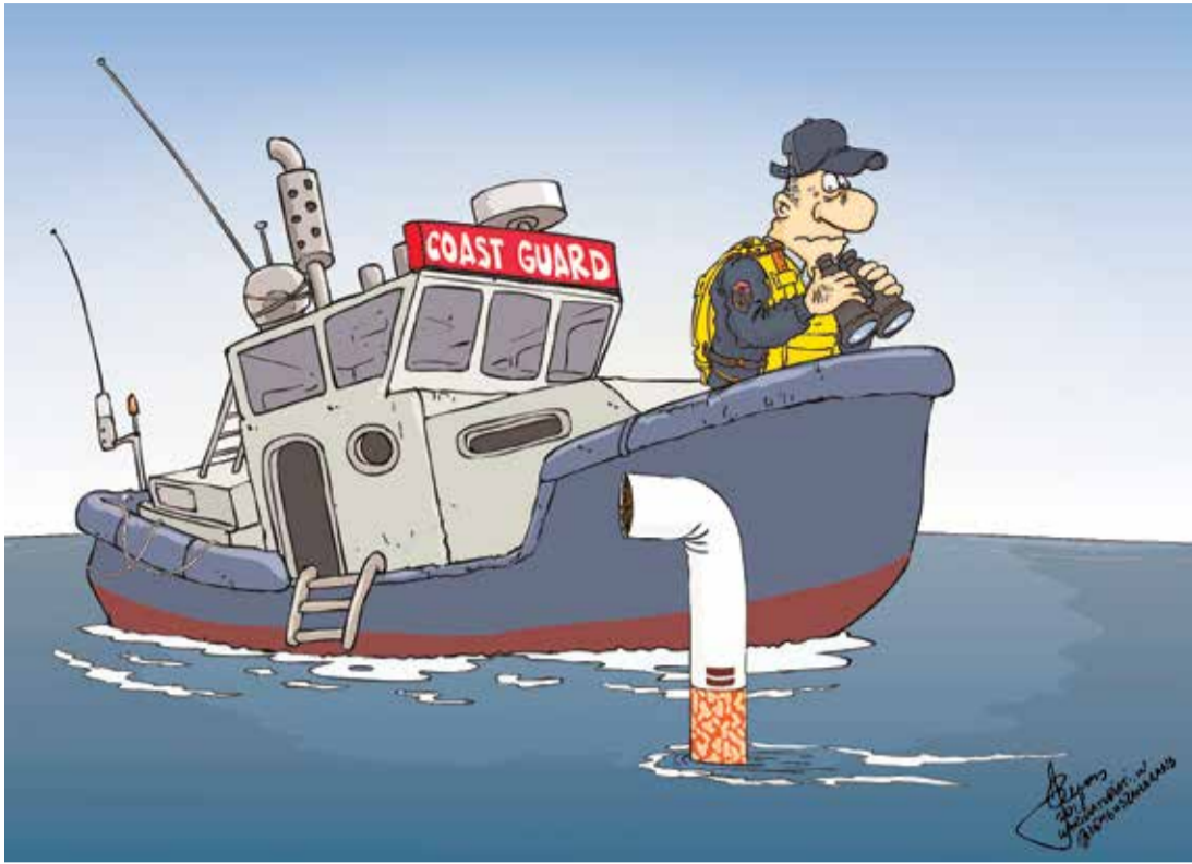
Рисунок – Zemgus