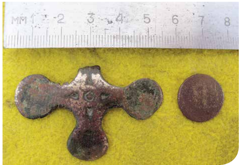
Ulda Ābiķa atrastais kuršu sievietes rotadatas fragments, kas varētu būt nācis no ugunskapiem.

Atradumus un informāciju par tiem Uldis likumā noteiktajā kārtībā paredzējis nodot muzejam. Viņš izteica cerību, ka arheologi pētījumus šai vietā turpinās. ♡