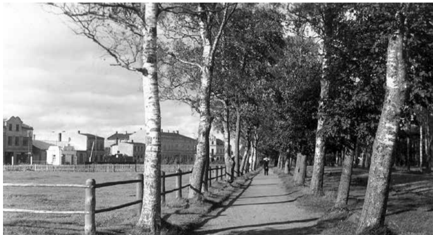
Фото, датируемое 20-ми годами XX века. Слева – участок за забором, где около 1909–1911 гг. находился «Цирк Горца»

После революции 1905 года властные структуры Российской империи устраивали очень строгую цензуру любых общественных мероприятий (литературные чтения, театральные постановки, концерты и т. д.). Цирк в этом отношении считался менее вредоносным, и в 1906 году в Вентспилсе разрешили построить здание стационарного цирка. Оно находилось на тогда еще не застроенном углу между улицей Лиела и улицами Кулдигас и Аннас. Вход для публики – со стороны улицы Аннас. В «Ventas Balss», выходящей в период между войнами, можно прочесть, что это было стабильное деревянное здание с ареной соответствующего размера, посыпанной опилками. Вокруг арены – покрытый красным плюшем барьер, а за ним – так называемые «первые места», где билеты самые дорогие. Для особо важных гостей предусмотрено несколько лож, где не экономили на красном плюше. «Вторые места» были на скамейках амфитеатра, а самые дешевые – на самом верху, в галерее, которую называли галеркой. Под галереей размещались хозяйственные помещения, конюшни и другие помещения для цир-