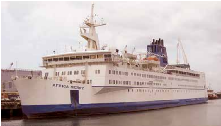
Kuģis "Africa Mercy" un tā kapteinis uz komandtiltiņa.

"Jā, mēs savā mazajā valstī vēl neesam sasnieguši vēlamo pārtības līmeni, bet arī badu neciešam. Jā, piekritu, nav korekti Latvijas turību salīdzināt ar kādas banānu republikas