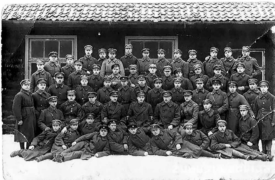
2. Ventspils kājnieku pulka 4. rotas strēlnieki 1919. gada februārī.

Tai pat laikā Ventspilī zibens ātrumā apskrēja ziņa, ka ap pusdienas laiku ostā ienāk