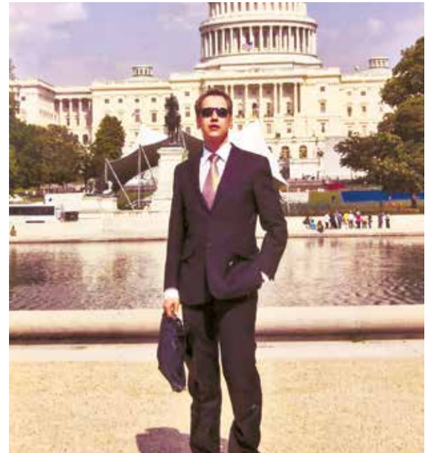
Возле Капитолия во время стажировки в США, 2009 год.

Совершенно иной опыт он начал приобретать, когда подал заявление на работу в комиссию по делам Европейского Союза: «Допускаю, что был одним из сотни претендентов, беседа длилась где-то около получаса, мне обещали сообщить результат позднее, но я покидал дом на улице Екаба с