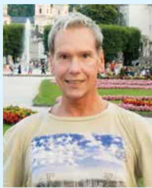
Администратор координации законодательства ЕП Эйнар Пункстиньш.

Если посмотреть со стороны, то к родившемуся в семье сельских учителей Эйнару Пункстиньшу можно полностью отнести известное английское выражение "Self-made man", что буквально означает «Человек, который сделал себя сам». Под этим понимая, что человек только и единственно сам пробил себе дорогу в жизнь и исполнил задуманное. Сам же Эйнар в своём выборе жизненного пути, который привёл его к теперешнему месту работы в престижной должности юриста в Европейском парламенте (ЕП) в Брюсселе никакого особого «пробивания дороги» не усматривает. Он считает, что такую возможность, как и многим другим, в своё время с достаточной благосклонностью предоставило время геополитических перемен. Эйнар был среди тех, у кого хватило ума и силы воли эту возможность использовать. Самым трудным было начало, которое совпало с закатом советской империи.