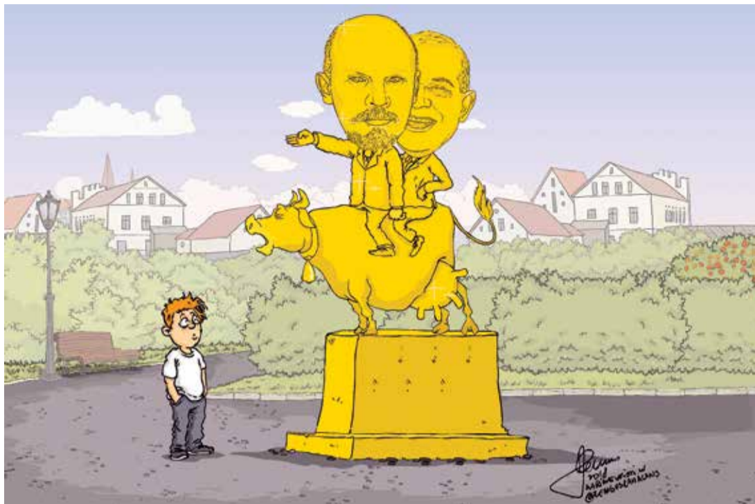
Рисунок – Zemtus