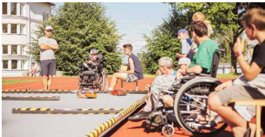
Лагерь в Пелчи в 2018 году.