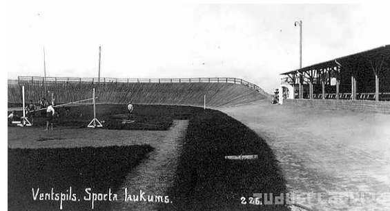
Sporta biedrības „Spars” sporta laukums.

1921. gads jaunajā Latvijas valstī vēl bija gana grūts. Ļoti daudz kā trūka, tomēr dzīvesprieka un optimisma bija papilnam. Kara rētas dziļi pamazām, bet cilvēki gribēja priecāties un dzīvot ar pilnu krūti. Arī Ventspilī. Ievērojams tā gada notikums bija sporta biedrības „Spars” sporta laukuma (tagadējais Olimpiskais centrs) iekārtošana pašu spēkiem. 19. jūnijā jaunajā laukumā notika pirmās sacensības – „eksternas sacīkstes”, t.i., tajās piedalījās arī sportisti no Rīgas, pavisam sešpadsmit. Netrūka ne orķestra, ne dalībnieku gājiens, ne svinīgas apbalvo-