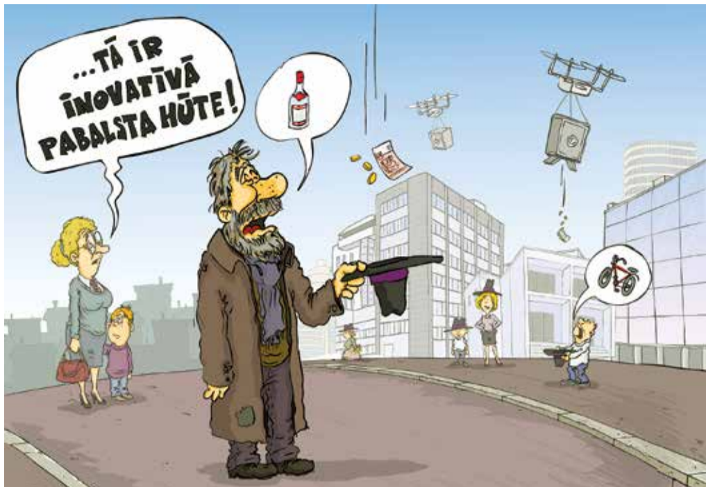
Рисунок – Zengius