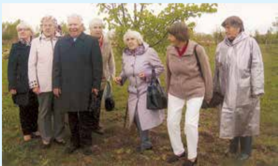
Ventspils novada politiski represētie apciemo viņu agrāk iestādīto gobu Likteņdārzā.

Ar Ventspils novada politiski represēto apvienības valdes locekļiem viņu kārtējās kopā sanāšanas reizē Ventspilnieks.lv tikās šā mēneša pirmajā ceturtdienā. Ar nodomu apjautāties, vai un kā apvienības biedri iecerējuši 14. jūnijā pieminēt masveida deportācijas, kas tieši ir skārušas daudzus apvienības biedrus un viņu tuviniekus. Represēto apvienībai kopš dibināšanas šopavas aritējusi trīsdesmitā gadskārtā, iespējams, ka traģisko datumu atzīmēšanā ir izveidojušas savas tradīcijas un rituāli.