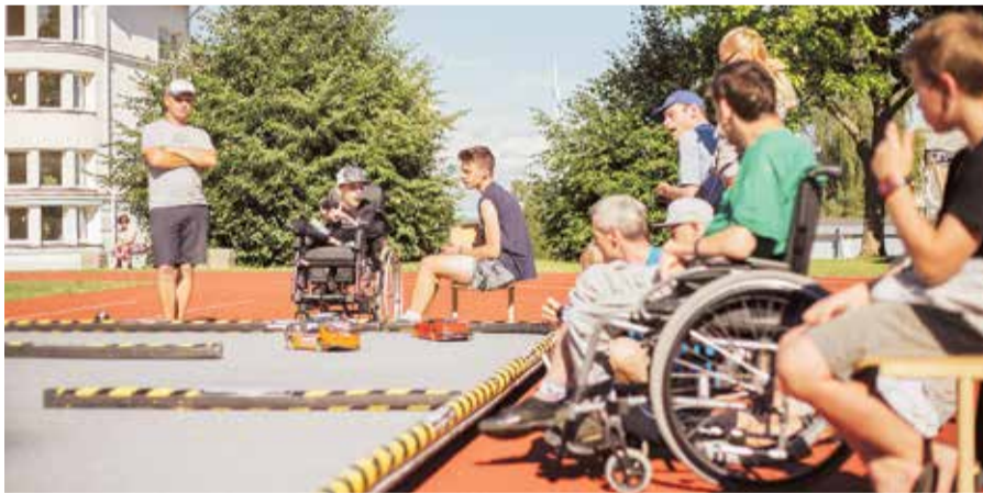
Nometnē Pelčos 2018. gadā.

"Starp mūsu bērniem un jauniešiem ir tādi, kuriem nometne Pelčos ir vienīgā iespēja izrauties no ikdienas ista-