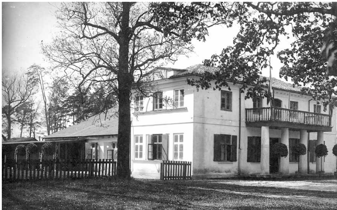
Puherta muižīņa Kuldīgas ceļa malā – līdz I Pasaules karam ventspilnieku iecienīta izklaides vieta, kur devās ne vien klausīties mūziku un dejot, bet arī skatīties sporta sacīkstes un svinēt svētkus.