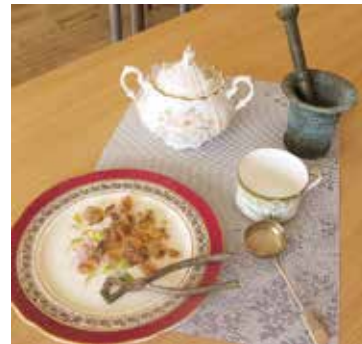
Muižas trauki un galda piederumi no laikiem, kad Zūrās ražoja cukuru.

Tas noticis laikā, kad atjaunotā Latvija šo mācību iestādi kā audzēkņus piesaistīt nespējīgu nolēmusi slēgt, atstājot uz ielas daudzus tās ilggadējos darbiniekus. Inta