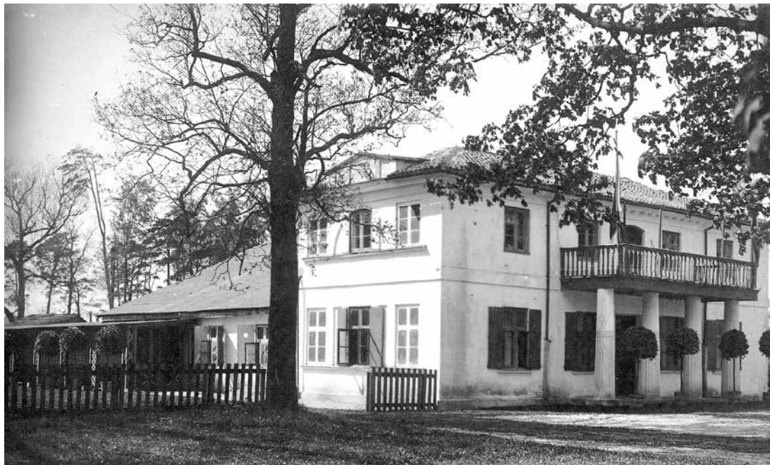
Имение Пухерта возле Кулдигской дороги – до Первой Мировой войны любимое место развлечения вентспилчан, куда отправлялись не только послушать музыку и потанцевать, но и понаблюдать за спортивными состязаниями и отпраздновать праздник.

Следует добавить, что Лесное кладбище (приблизительно 1/3 нынешней территории) отмерили и огородили уже в 1905 году, однако хоронить там было нельзя, пока земля не была освящена. Успоших возили на парвентское кладбище Кантсонов, которое тогда называлось городским кладбищем.