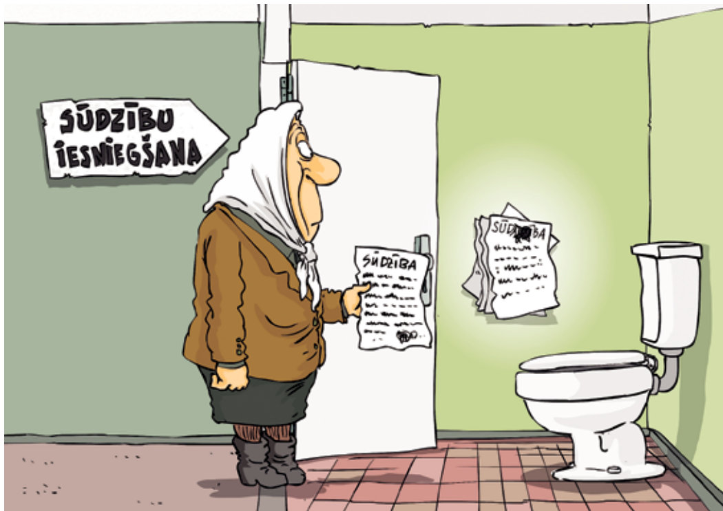
Рисунок – Zengus