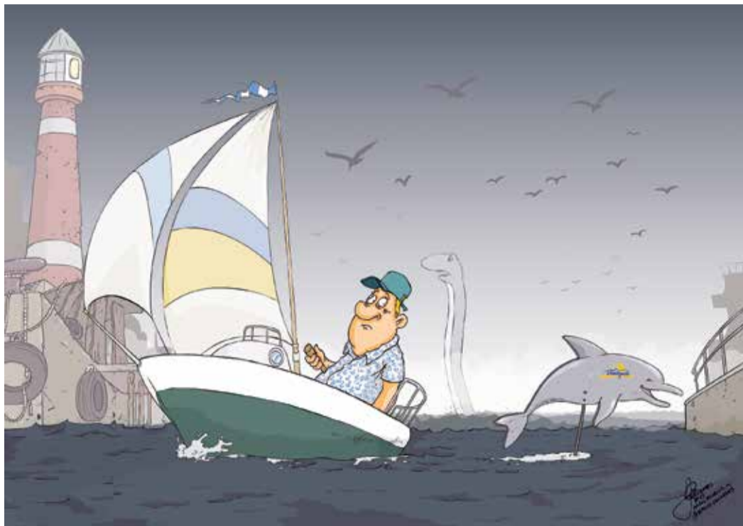
Рисунок – Zengius