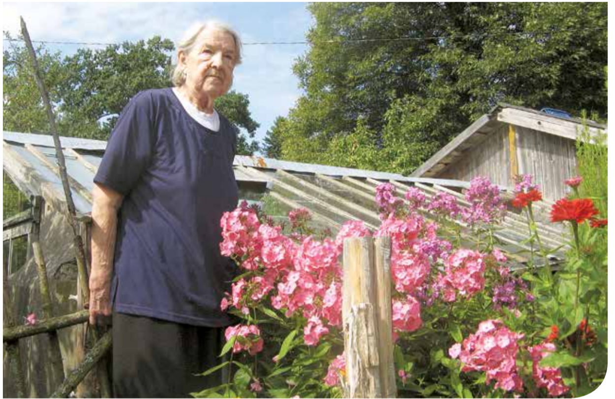
С флоксами в ожидании осени.

«Отец, выражаясь современным языком, был очень коммуникабельным. И в немецкое, и в русское время он был