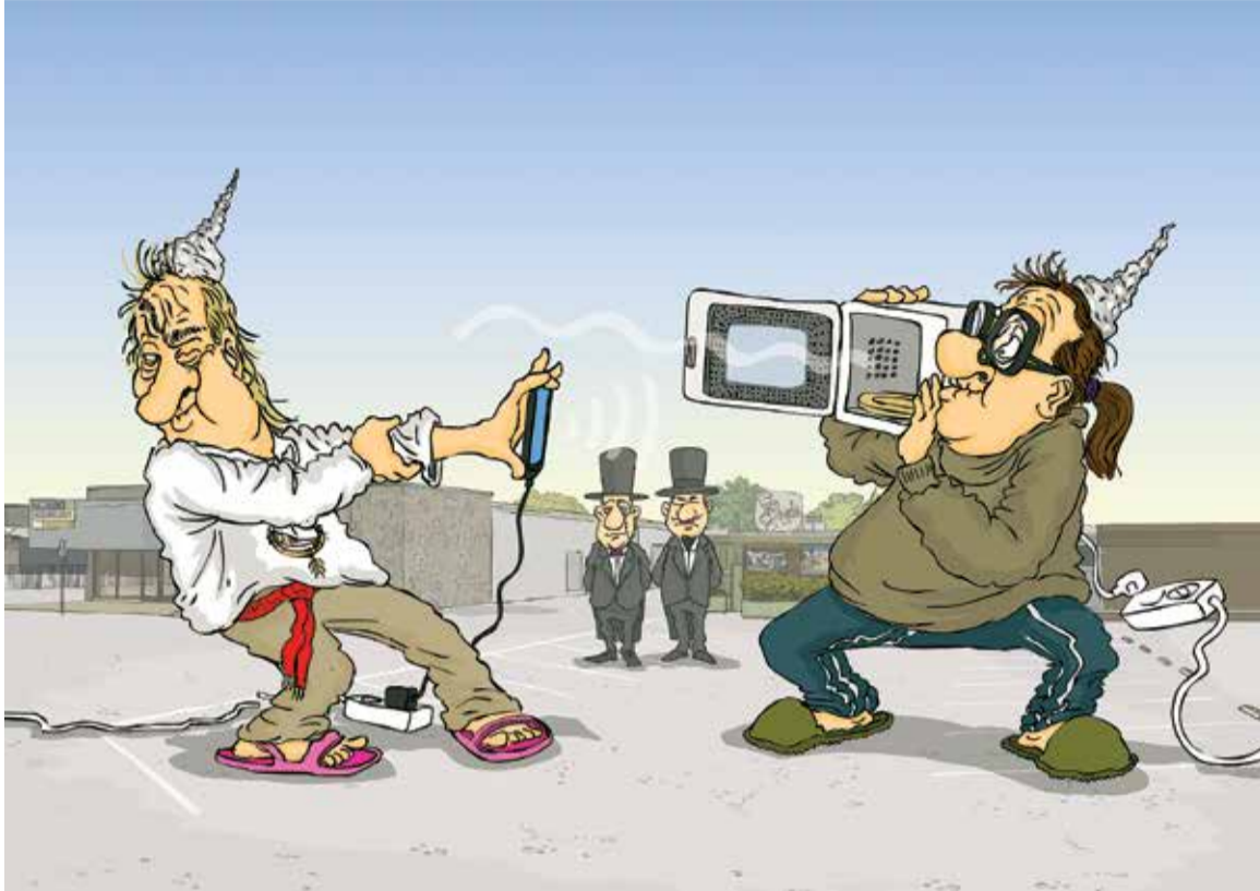
Рисуюнок – Zengius