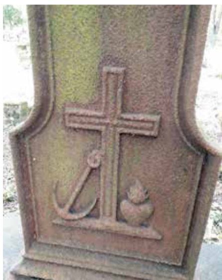
Emblēma kāda krusta pakājē – krusts, enkurs, sirds.