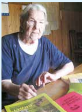
Savā mājā ar saviem gara bērniem.