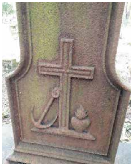
Эмблема у подножия креста – крест, якорь, сердце.