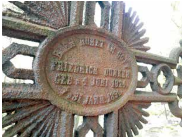
Памятная надпись Фридриху Дункеру.

К некоторым памятникам или крестам прикреплены своеобразные эмблемы. Одна, которая, кажется, характерна для периода романтизма, изображает якорь, крест и сердце, что символизирует надежду, веру и любовь. Символы трех прекраснейших