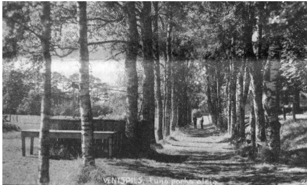
Ventspils Lunaparks. Šeit notika dažādi plaši sarīkojumi, tostarp 1929. gada Ziemeļkurzemes Dziesmu svētki.

1939. gada 6. augustā tūkstošiem ventspilnieku devās uz aviācijas svētkiem Ventspils aerodromā. Lidojumu demonstrējums piedalījās aizsargu aviācijas pulka lidotāji ar 5 lidmašīnām, aerokluba lidotāji ar 2 lidmašī-