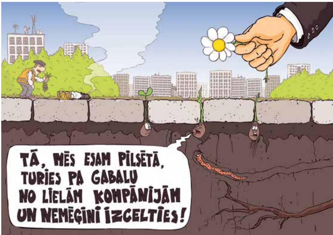
Рисунок – Zengus