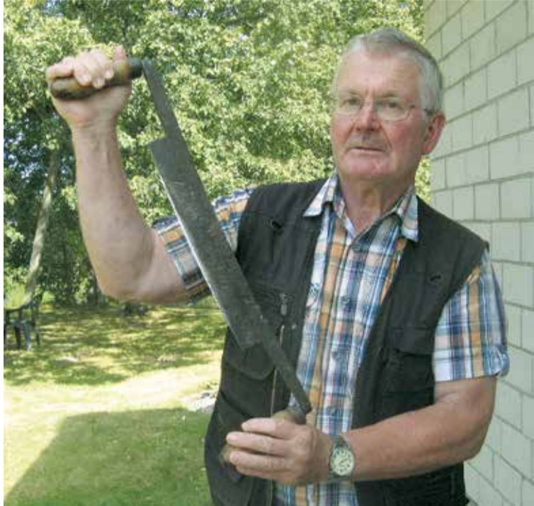
Выкованное дедом сто лет назад орудие труда по-прежнему острое.