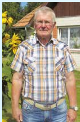
"Jāņkalnos", pie pašā celtās mājas, sievas koptā dārzā.

Jau deviņpadsmit gadu Ventmalā, Ostas promenādē netālu no Livonijas Ordeņa pils uz senatnīgi atveidota čuguna sola sēž Berlīnē bronza lietais Krišjānis Valdemārs (1825 – 1891). "Latvietis" – tā viņš sevi pieticīgi un reizē lepni dēvējis, mācoties Tērbatā. "Dižais latvietis" – tā par izcilu veikumu