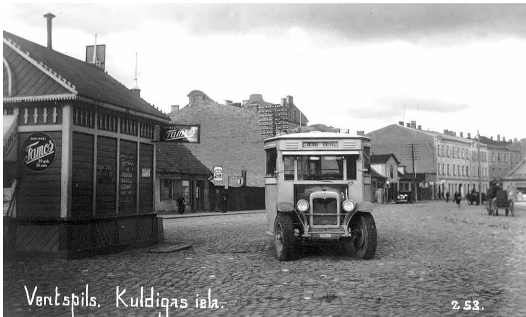
Автобус «Вентспилс-Кулдига» на остановке возле киоска.

Возле Овиши наблюдались несколько смерчей (тайфунов). «Огромные воронки словно выростали из моря и тянулись до самых облаков, двигаясь с большой скоростью в разных направлениях. Это явление в Балтийском море является чрезвычайно редким». («Вентас Балсс».)