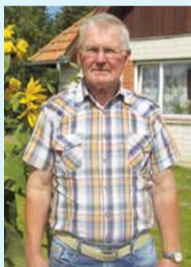
В «Янькални», возле собственноручно построенного дома, в саду, за которым ухаживает жена.

Вот уже девятнадцать лет на набережной Венты, на променаде улицы Остас, недалеко от замка Ливонского ордена на созданной под старину чугунной скамейке сидит вылитый в Берлине из бронзы Кришьянис Валдемарс (1825 – 1891). «Латыш» – так он скромно, а иногда с гордостью называл себя, когда учился в Тарту. «Великий латыш» – так за выдающиеся заслуги в народном хозяйстве