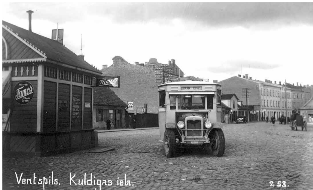
Autobuss „Ventspils-Kuldiņa” pieturvietā pie kioska.

nām, kā arī divvietīga buru lidmašīna (planieris), ko pilotēja aizsargu aviācijas pulka komandiera palīgs kapteinis Dimza.