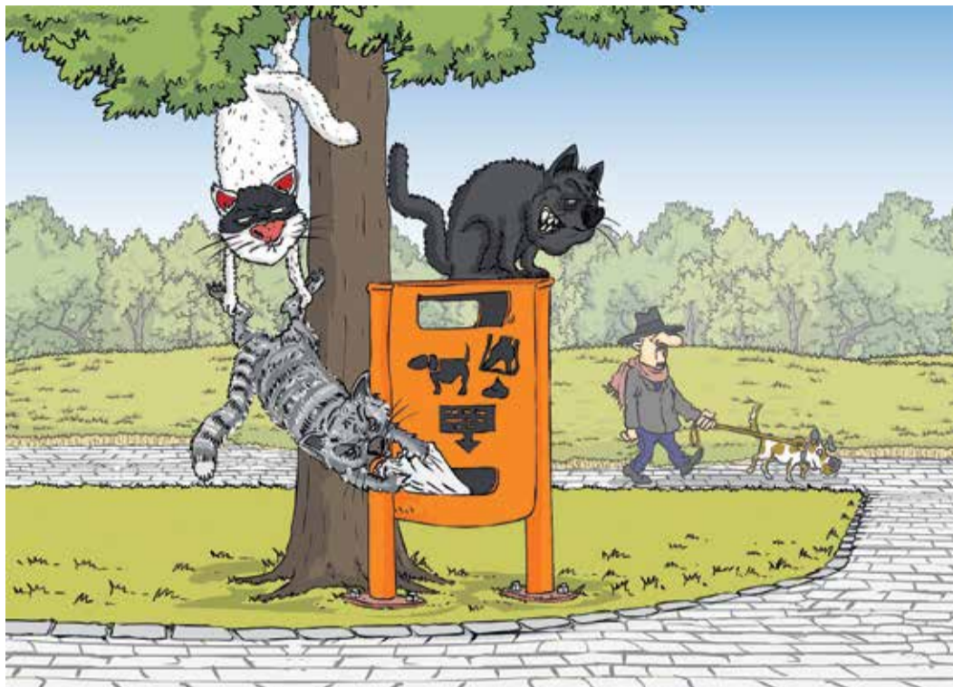
Рисунок – Zengius