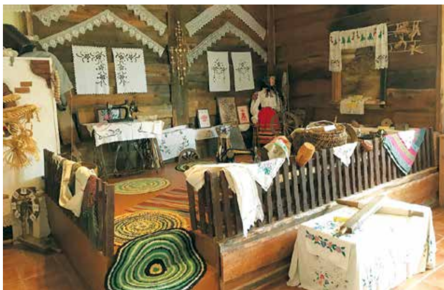
Tautisko dvieļu darināšana, tautisko rakstu, jostu, segu aušanas maniere latviešiem un baltkrieviem ir pārsteidzoši līdzīga.