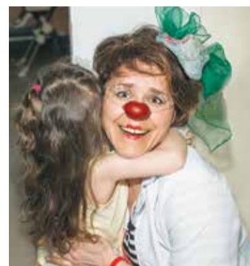
Paldies, mīļais klauniņ!