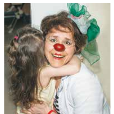
Спасибо, милый клоун!