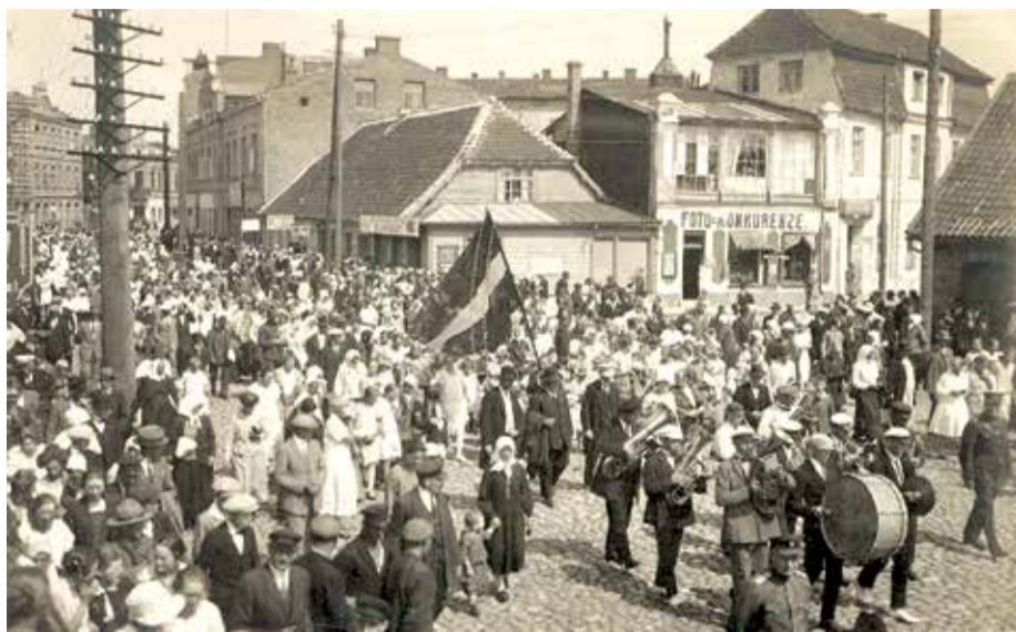
Шествие на улице Кулдигас во время Детского праздника. 20-е гг. XX столетия.

«Цель общества – собрать вокруг себя молодежь и воспитывать ее в религиозно-этическом духе, уберечь от вредных впечатлений окружающего мира», – так было сказано в уставе. Под вредными впечатлениями окружающего мира понимаются преимущественно кабаки, число которых в стремительно растущем городе и окрестных селениях составляло около ста, а также различные вечеринки, на которых основательно выпивали и после которых неизбежно возникали драки. Тогда, то есть в 1908 году, единственной возможностью культурных развлечений были театральные представления и концерты, но очень редко и не всегда хорошего качества; немного позднее начали открываться так называемые электротeatры (кинотеатры). Однако новое общество дало молодым людям возможность не только смотреть и слушать, но и самим заниматься творческой деятельностью. После утверждения устава в октябре 1908 года Общество друзей юншества, насчитывав-