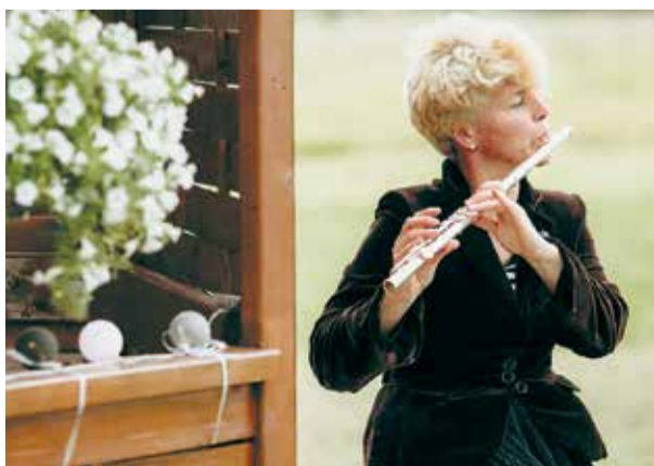
Музыка на радость себе.