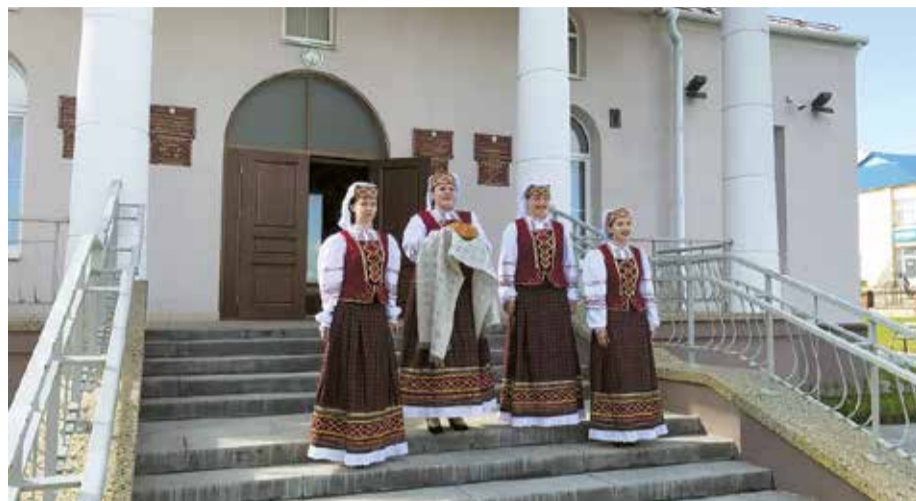
В гостях в белорусском городе Гродно в 2017 году.

В самой середине лета, уже пятнадцатый год подряд общество «Спадчына» организует и отмечает в Вентспилсе традиционные Дни белорусской культуры «От Лиго до Купалы».