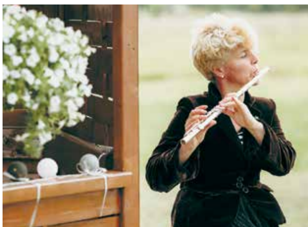
Mūzika savam priekam.