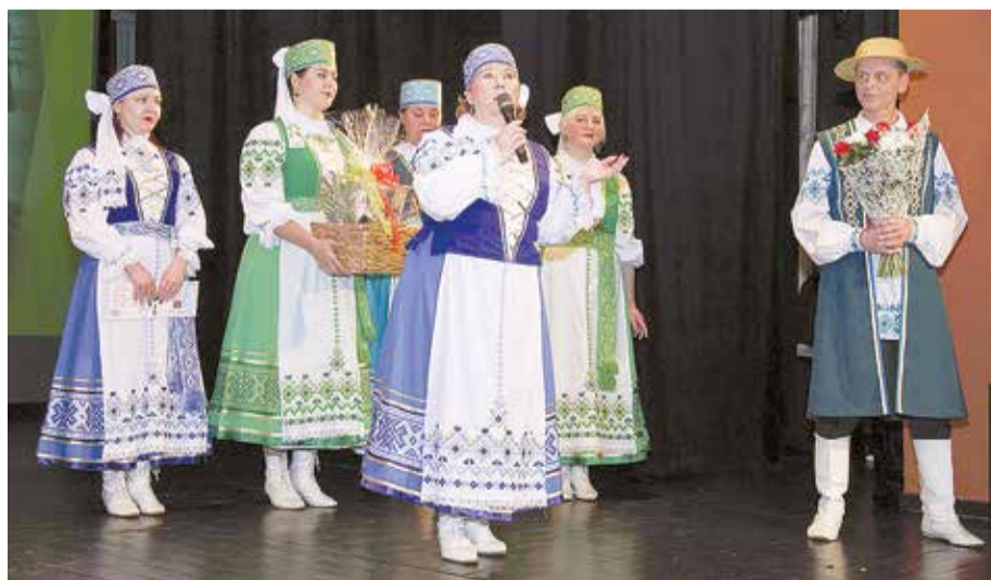
Аттрактивный коллектив «Журавинка» во время торжеств в честь 20-летнего юбилея общества.