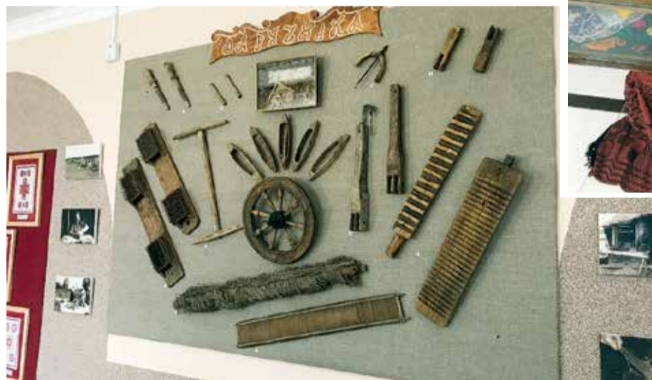
Vēsturiski saglabājušies baltkrievu darba rīki ir identiski tiem, kādus varam aplūkot mūsu brīvdabas muzejos.