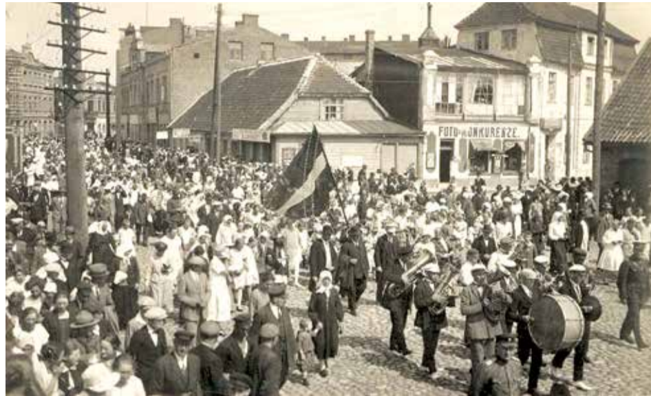
Bērnu svētku gājiens Kuldīgas ielā. 20. gs. 20. gadi.