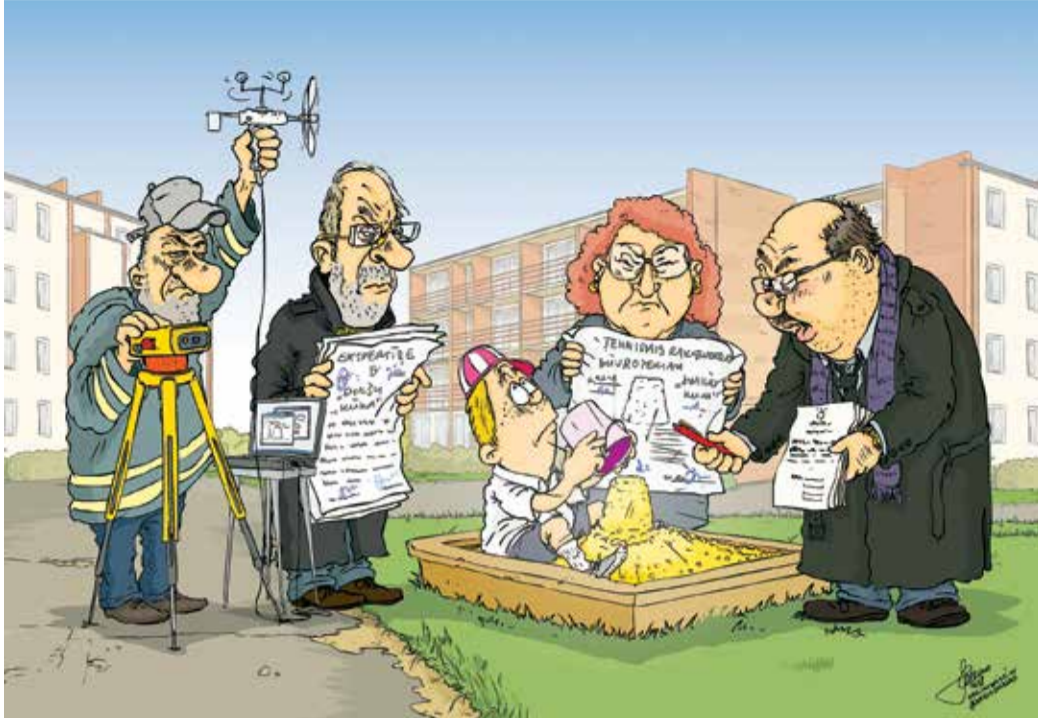
Рисунок – Zengius