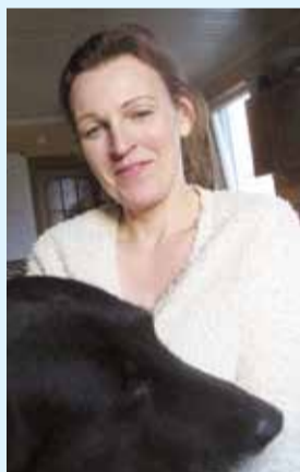
Андра с одним из своих четвероногих питомцев.