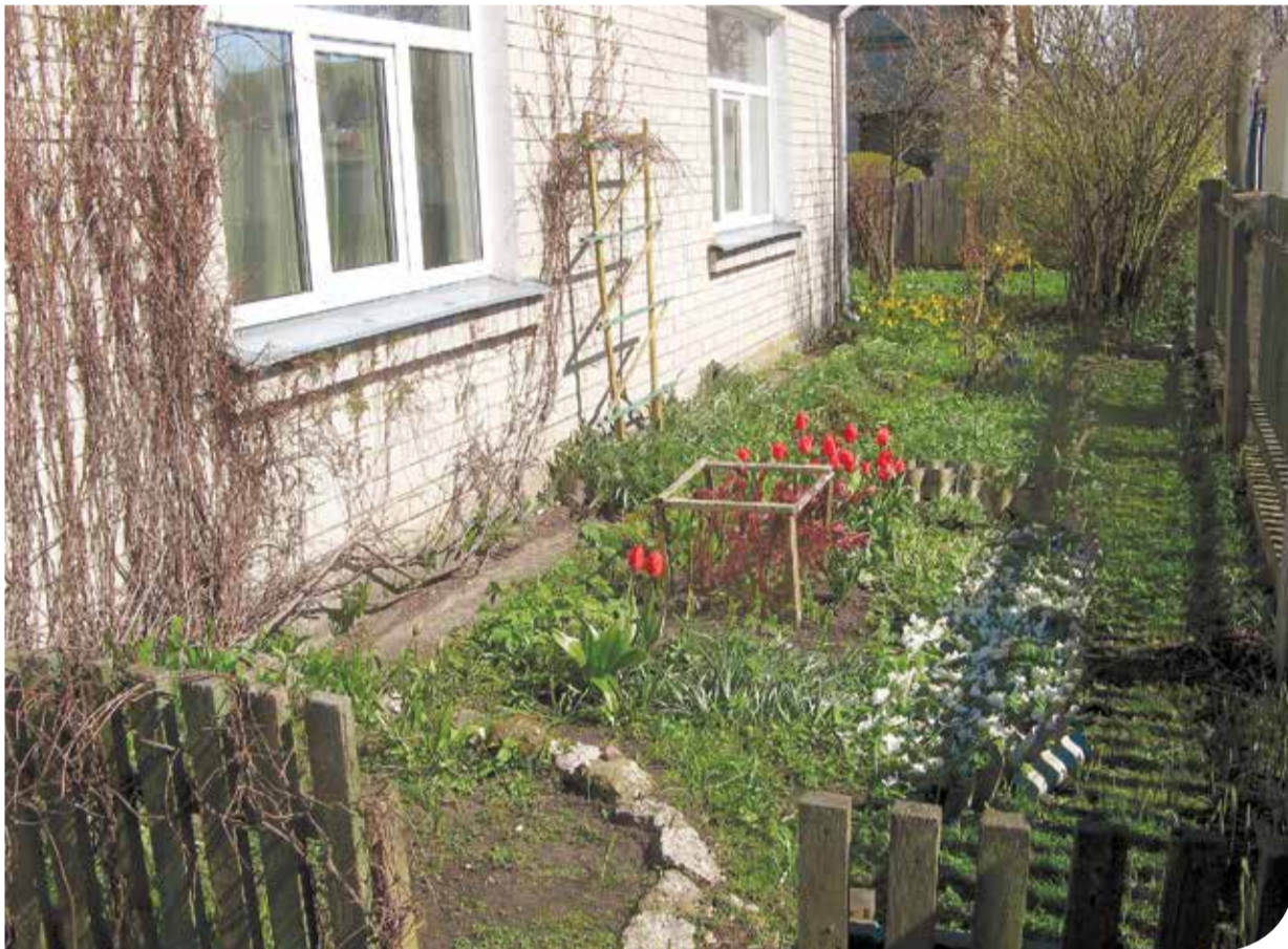
Pie Zigrīdas mājas Bērzu ielā, tāpat kā bērnības mājās Ozolos, ik vasaru zied puķes, kuru kopšanai spēka aizvien mazāk.