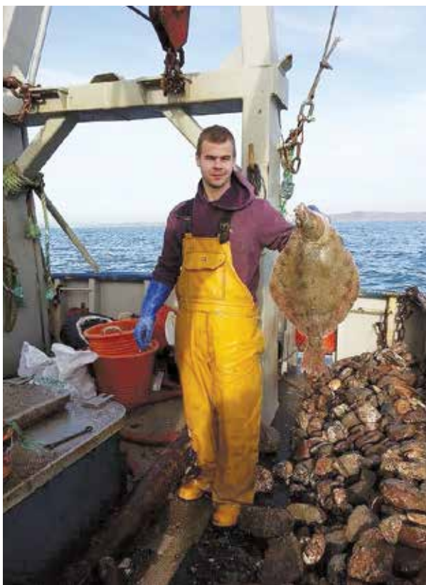
Выловленная у берегов Англии камбала. И правда крупная.

После восстановления независимости, казалось, что прибрежные рыбаки оживились. В свое время самоуправление в Вентспилсе достаточно серьезно говорило о торговле рыбой прямо с судов и лодок на причалах, которые находятся рядом с рынком, но все это оказалось пустым сотрясанием воздуха. Эдгарс свой пока что небольшой и по причине неважных погодных условий не слишком регулярный улов