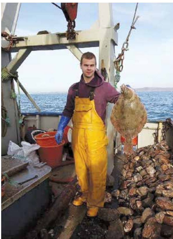
Anglijas piekrastē izvilktā bute. Tiešām pamatīga.