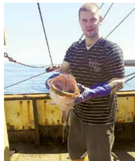
Улов у берегов Англии. Выглядит не особенно привлекательно.

«Вентспилчане – гордый народ, и не дай бог мне назвать их красивый город просто рыболовецким селением. Вентспилс – величественный портовый город. И раз уж я ска-