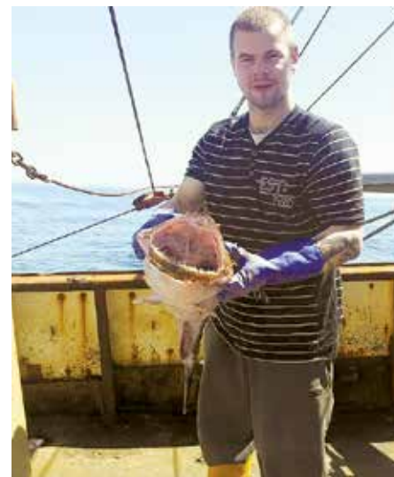
Loms Anglijas piekrastē. Izskatās pabriesmīgs.

“Ventspilnieki – lepni ļaudis, un, lai Dievs mani pasargā, ja es viņu skaisto pilsē-