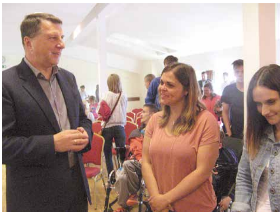
Valsts prezidents sarunā ar sargeņģeli no ASV.