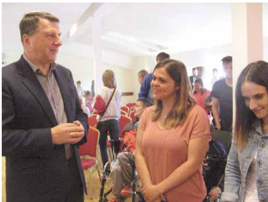
Президент беседует с «ангелом-хранителем» из США.

Проект «Планета надежд» доказывает, что преумножать человечность во взаимоотношениях между самыми разными людьми, а также учреждениями и предпринимателями нужно и возможно.