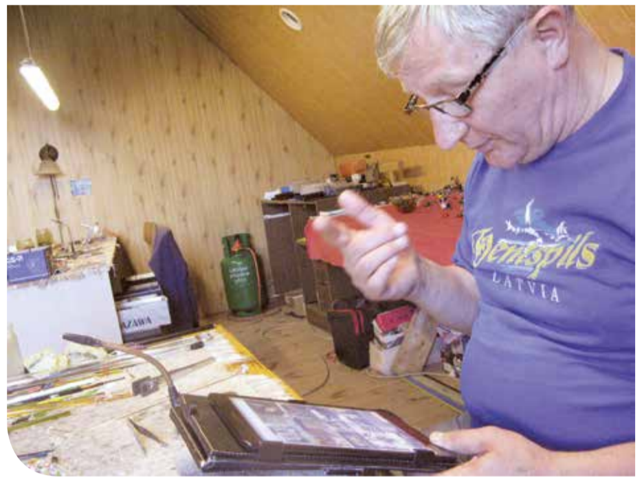
Время от времени приходится «консультироваться» и с компьютером.