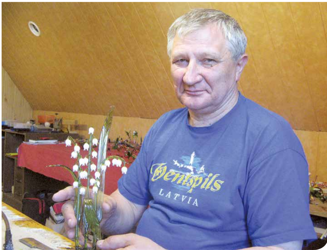
Еще красивее, чем в природе.