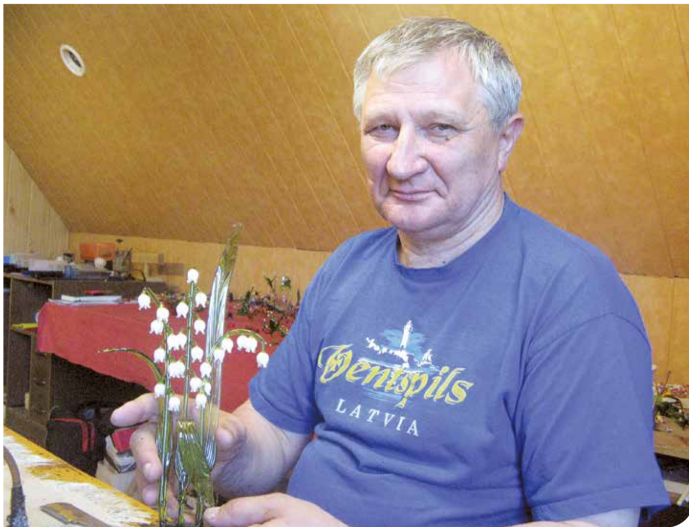
Vēl skaistāka, nekā dabā.