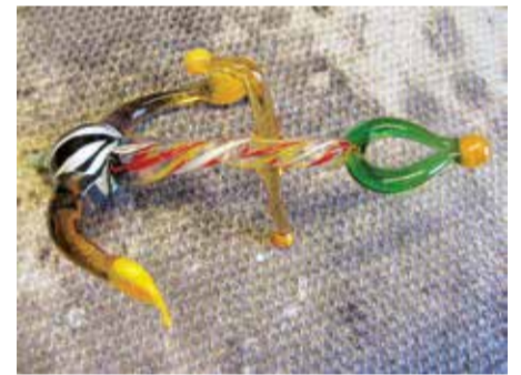
Как же в Вентспилсе без якоря?