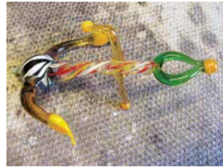
Kā tad Ventspilī bez enkura?