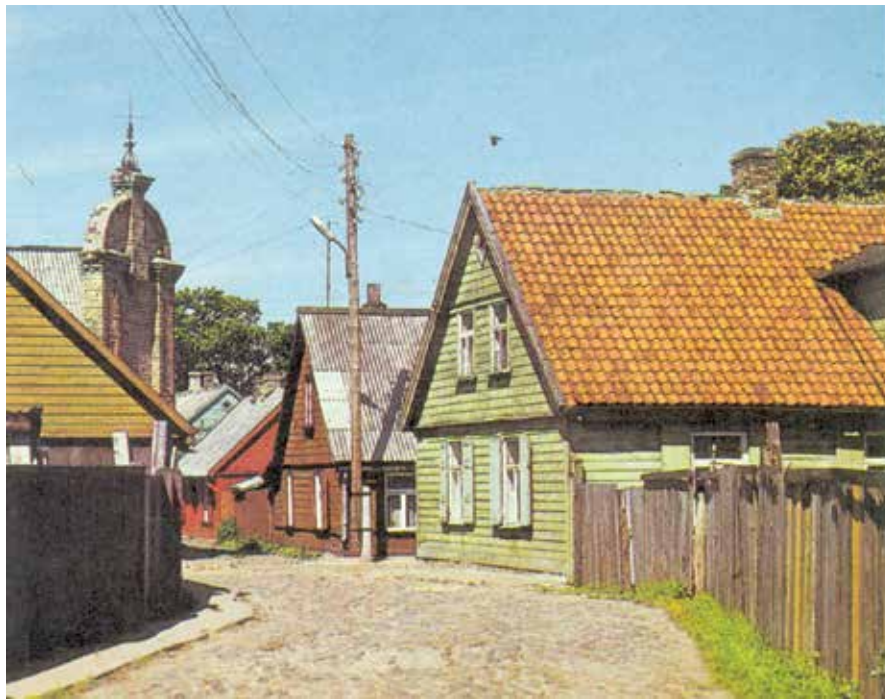
Līvu iela septiņdesmitajos gados.

ieraksts „dom Princa” 1853. g. Ventspils kartē, apzīmējot zemes gabalu blakus tag. Vasarnīcu ielai no Avotu ielas līdz Kroņa ielai, kur turpmāk dzīvojuši vecā lībiešu patriarha pēcteči.