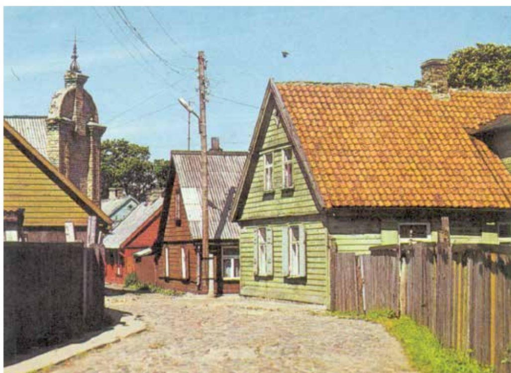
Улица Ливу в семидесятые годы.

Однако Остгалс совсем не такой древний; по сравнению со Старым городом и даже с окрестностями площади Тиргус Остгалс – просто юноша. Картинки из исторического альбома города открывают нам, что лишь к середине 19-го века, когда прозвучал призыв царской России к крестьянам переселиться на песчаные территории вблизи порта (чтобы остановить попадание в порт утекающих песков), относятся истоки появления Остгалса.