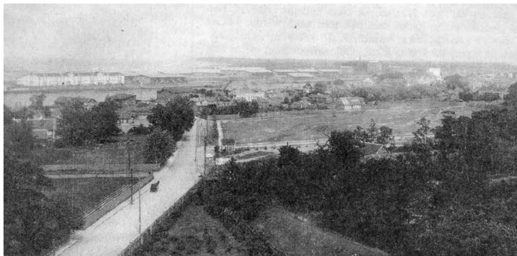
Изображение 20-х гг. 20-го века. Вид на улицу Васарницу. Вдалеке виднеется Вента; на правой стороне – перекресток с улицей Юрас, за ней – Эспланада, на переднем плане – луна-парк. Слева – начало улицы Ливу.

Каждому вентспилчанину известно, что Остгалс – это часть нашего города, которая находится между улицей Васарницу, Вентой и морем. В наши дни это тихий и не особенно плотно населенный район, в котором царит старинная, почти музейная атмосфера. Однако еще полвека назад, не говоря о более отдаленном времени, Остгалс был оживленным рыбацким поселком, вросшим в городскую территорию, по которому ветер разносил запах рыбы, дегтя и дыма, где звучали громкие голоса рыбаков и их жен, были слышны крики чаек и возгласы детей рыбаков.