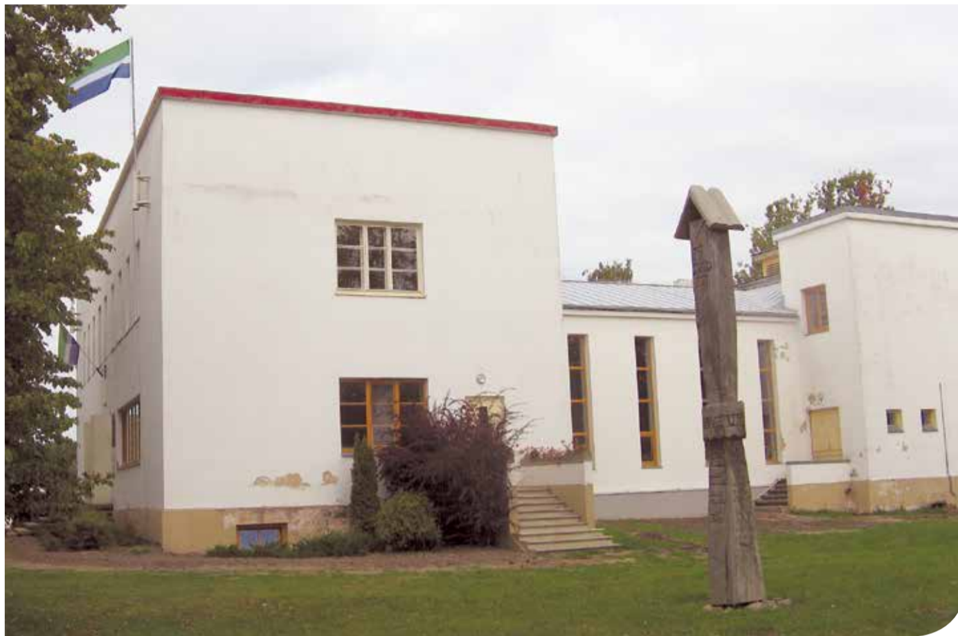
Историческое охраняемое здание – ливский Народный дом, построенный в 1939 году.

На мероприятие пришло много вентспилчан. И не только потому, что в этом городе самое большое отделение СЛ. Именно их земляк Ф. Кронбергс неполные восемьдесят лет назад руководил такими важными для ливов строительными работами, сред-