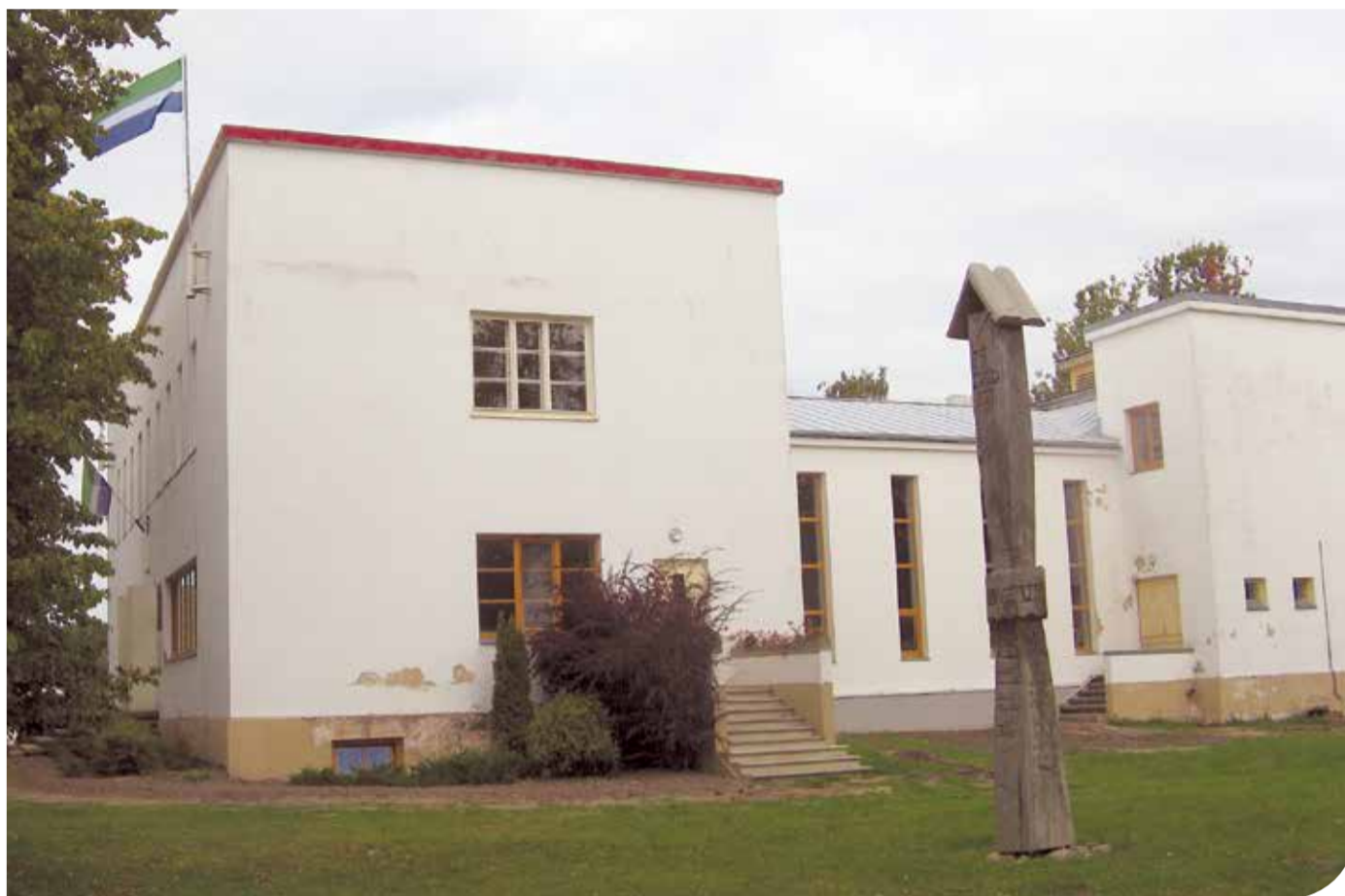
Vēsturiska un aizsargājama ēka – 1939. gadā uzceltais lībiešu Tautas nams.