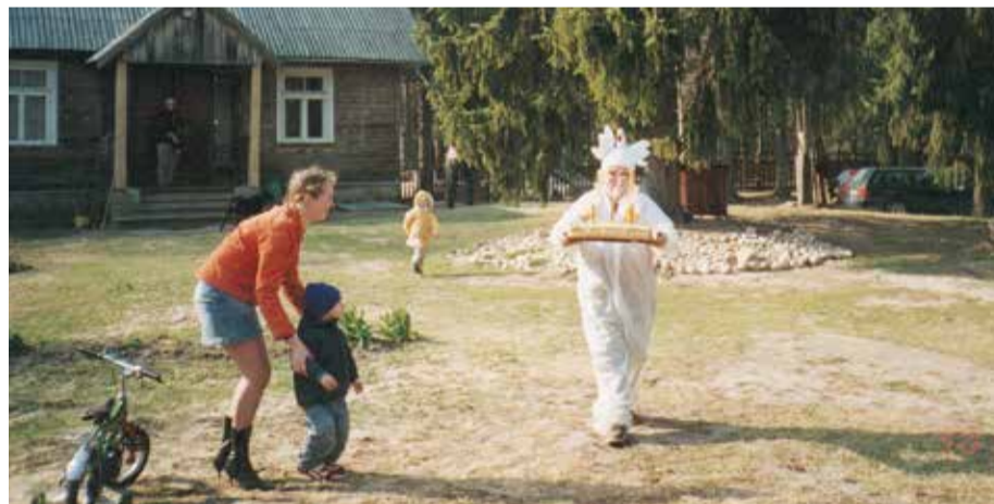
Гном может быть и в роли курицы, когда нужно поздравить внучку и подарить ей клубничный торт.