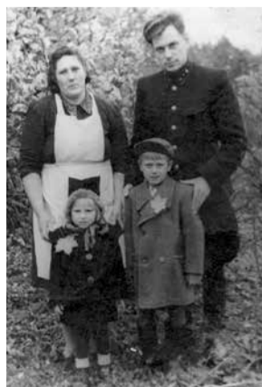
Семья Видениексов, еще в деревне.