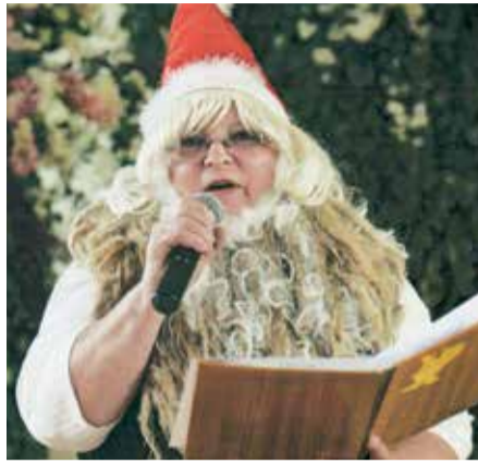
Гном произносит напутствие выпускникам.

У Гнома, в отличие от официальных лиц, было и еще одно преимущество: 1 сентября явиться на мероприятие не в черном лимузине, а, например, в ковше экскаватора, кабине трактора, двигая тележку с мороженым, в конной упряжке или на велосипеде. Обычно с собой брался подарок от спонсоров – корзина со свежим хлебом, который потом с удовольствием съедается в классе и учительской с вареньем, принесенным из дома. Выпускникам традиционно доставалась корзина с клубничкой и напутствия от