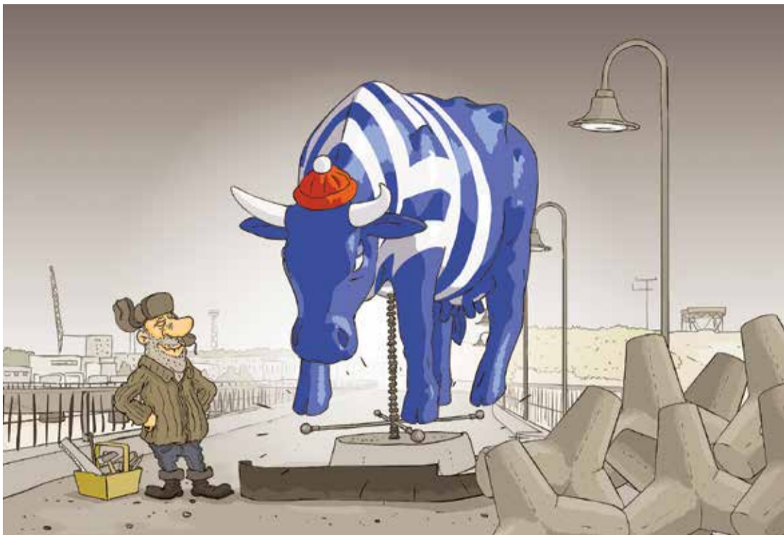
Рисунок – Zengius