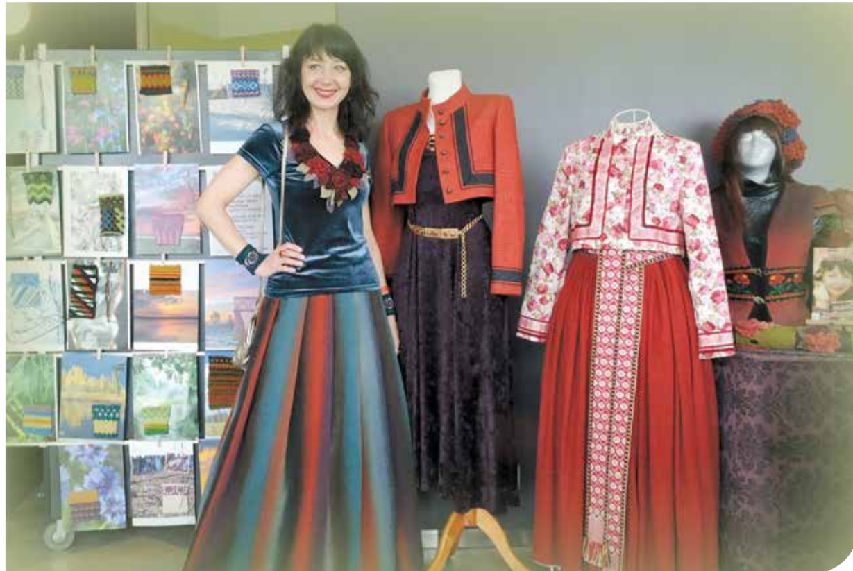
Ķīnā, demonstrējot suitu tautas tērpus.

"Pēc 8. klases gribēju tikt, bet neieklūvu Liepājas Lietišķās mākslas vidusskolā. Aizgāju mācīties 48. arodividusskolā, kur