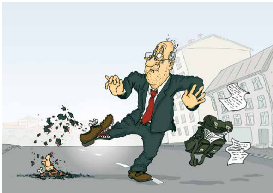
Рисунок – Zengius