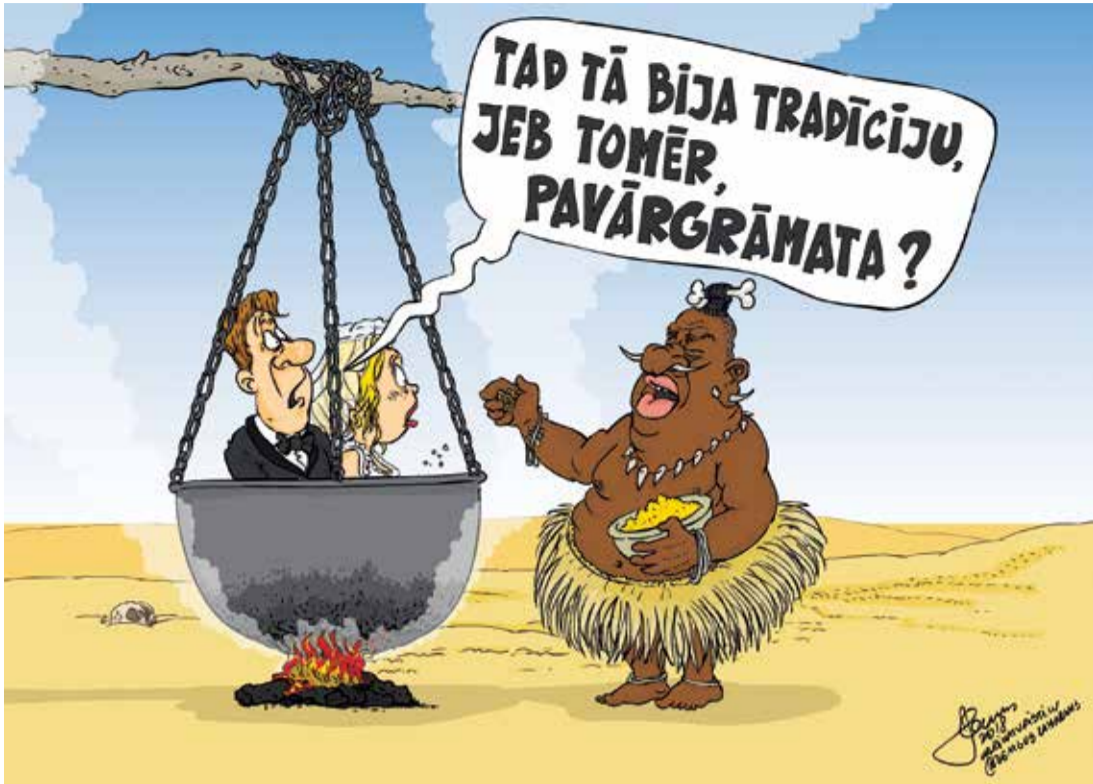
Рисунк – Zengus