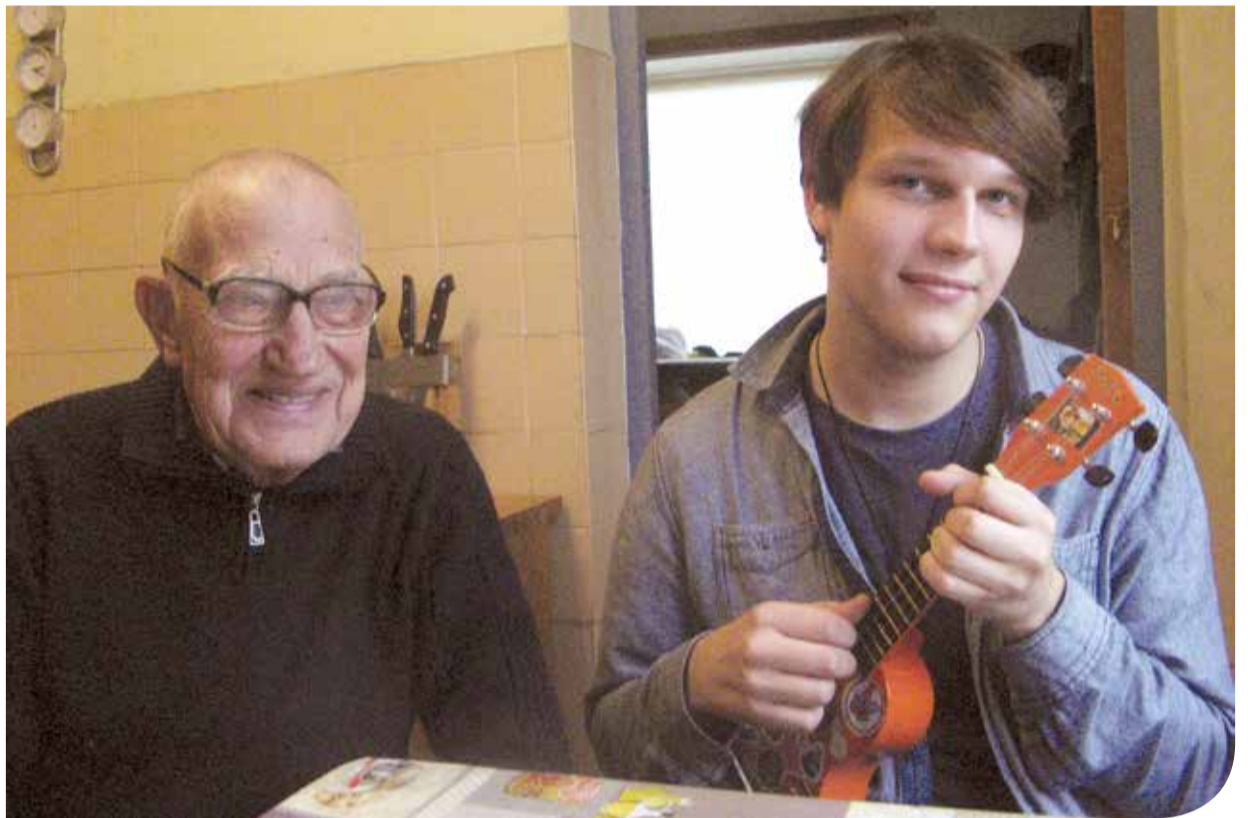
Дедушка охотно слушает, как в руках внука поёт маломерная гитара Гавайских островов – укулеле.

Это особенно можно было заметить, когда вместе с другими юными вокалистами давали концерт под открытым небом на берегу Мёртвого моря», – преподаватель не боится перехвалить воспитанника, так как поняла, что для него самосовершенствование стало необходимостью.