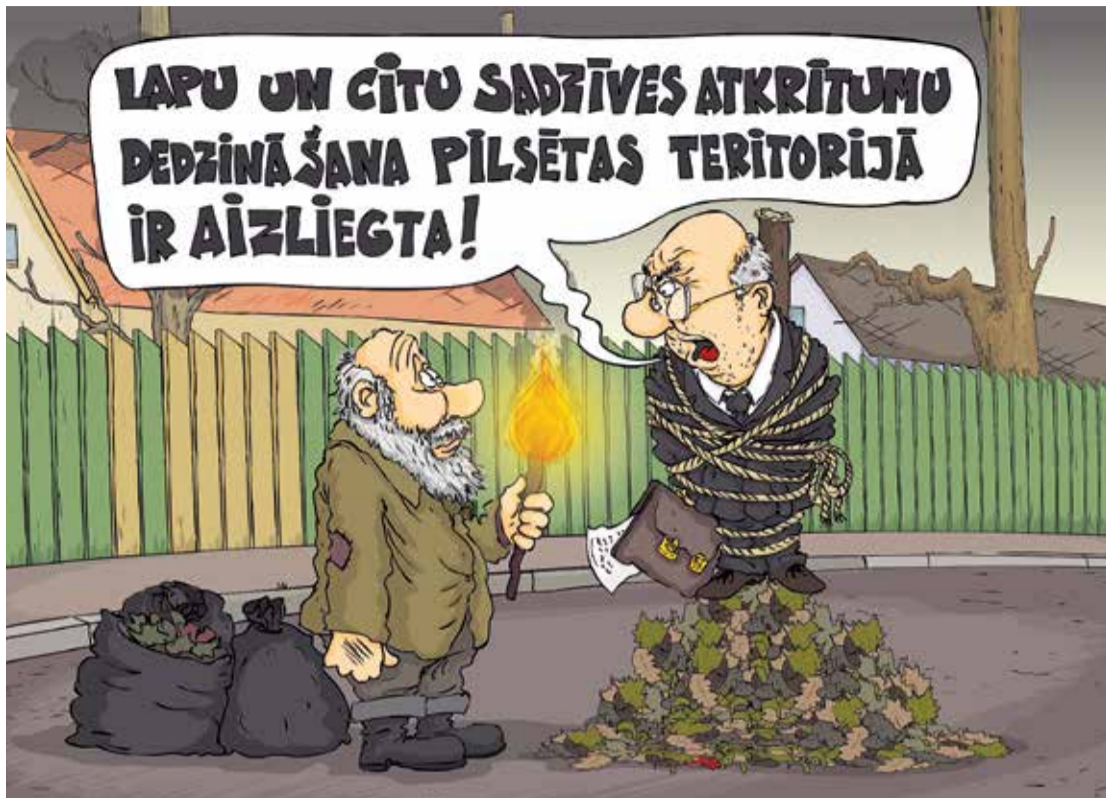
Рисунок – Zengus