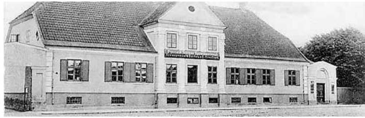
Построенный в XVIII веке дом на улице Кулдигас, 13. Фото начала XX века

И там же улица Звана (Колокольная). Заинтересованный вентспилчанин, возможно, задавал себе вопрос – почему Звана? Какая связь существует между этой улицей и колоколами? Ответ нужно искать в еще более древней истории, чем та эпоха, которую мы рассматриваем, а именно, в XVII столетии, в квартале между улицами Звана, Сколас, Тиргус и набережной Венты располагалось кладбище с церковью. Ранее мы уже рассказывали, что башня этой церкви была так некачественно построена, что горожане вынуждены были ее снести, чтобы не случилось несчастье. Но колокола должны были быть, чтобы оповещать о богослужениях, звонить в память об усопших и оповещать об опасности и пожарах. Поэтому в конце кладбища построили специальную колокольню, и отсюда пошло название улицы. Когда находившаяся в аварийном состоянии церковь в начале XVIII столетия снесли, башня осталась и продолжала служить упомянутым целям. Однако без проблем не обошлось ни для башни, ни для «немецкого кладбища». Вероятно, кладбище сначала было огорожено, но в 1764 году забора уже не было, и возникла весьма неприятная ситуация. В заявлении купцов в ратушу говорится: «Уважаемые купцы нижайше просят почтенную ратушу, чтобы она наказала старосте общины позаботиться о постройке забора вокруг кладбища и не допустила никаких