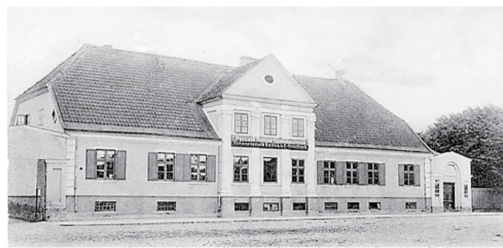
18. gadsimtā celtais nams Kuldīgas ielā 13.

Un turpat jau ir arī Zvana iela. Ieinteresēts ventspilnieks varbūt sev uzdevīs jautājumu – kāpēc Zvana? Kāds gan šai ieliņai sakars ar zvaniem? Atbilde jāmeklē vēl senākā vēsturē, nekā mūsu apskatāmais laikmets, proti, 17. gadsimtā kvartālā starp Zvana, Skolas, Tīrgus ielām un Ventmalu atradās kapsēta ar baznīcu. Iepriekš jau stāstījām, ka šai baznīcai tornis bija tik vārgi celts, ka pilsētnieki bija spiesti to nojaukt, lai nenotiktu nelaieme. Taču zvanam vajadzēja būt, – lai izvaņinātu dievkalpojumus, apzvanītu mirušos un šķindinātu trauksmi briesmu vai ugunsgrēku gadījumos. Tāpēc kapsētas galā uzcēla īpašu zvanu torni, un no tā ielai arī nosaukums. Kad avārijas stāvoklī esošo baznīcu 18. gadsimta sākumā nojauc, tornis palika un turpināja kalpot minētajām vajadzībām. Tomēr bez problēmām neiztika ne sākni, ne “vācu kapsēta”. Domājams, kapsēta sākotnēji bijusi apžogota, bet 1764. gadā žoga vairs nebija, un izveidojās gaužām nepatīkama situācija. Tirgotāju iesniegumā rātei rakstīts: “Cienītie tirgotāji pazemīgi lūdz godāto rāti, lai tā uzdod draudzes priekšniekiem gādāt par kapsētas žoga uzcelšanu un nepieļauj nekādu aizbildināšanos, vienlīdz kādu iemeslu dēļ. Lai mirušajiem zemē būtu miers, lai cūkas un citi dzīvnieki viņus neraktu ārā šejienes iedzīvotājiem par kaunu un apsmieku. Tāpat zvanu tornim, kas atrodas kapsētā, nevar tuvojties bez dzīvības briesmām. Tie pāris balstu, kas pie torņa piesieti, nespēj to noturēt tais-