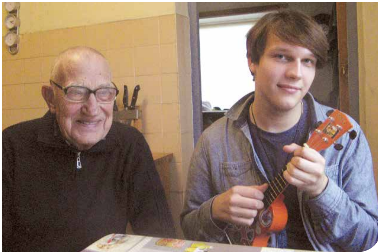
Vectēvs labprāt ieklausās, kā mazdēla rokās daino Havaju salu mazizmēra ģitāra ukulele.

jāpiedomā. Un tas jaunietim ļauj publikas priekšā atrasiēties un savu pārdzīvojumu emocionāli nodot skatītājiem. Izraēlā viņš dziedāja latviešu valodā, bet priekšnesums bija tik izteiksmīgs, ka to novērtēja ne vien žūrija, bet arī klausītāji. To īpaši varēja pamanīt, kad kopā ar citiem jaunajiem vokālistiem no Latvijas sniedzām brīvdabas koncertu Nāves jūras krastā,” skolotāja nebaidās pārslavēt audzēkni, jo sapratusi, ka viņam sevis pilnveidošana kļuvusi par nepieciešamību.