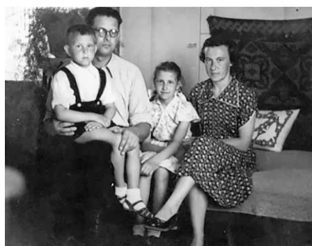
С родителями и сестрой в Валдемарпилсе.