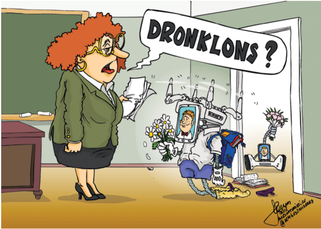
Рисунок – Zengius