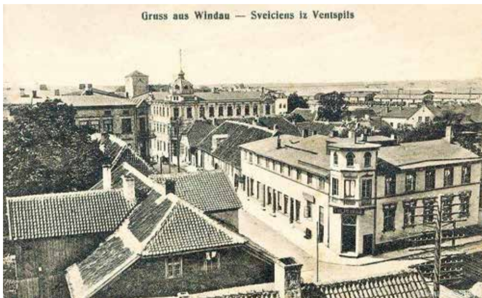
Перекресток улиц Пилс и Уденс. Первое десятилетие XX века.

тило красивую постройку на крыше. Еще один достойный упоминания дом того времени принадлежал вентспилсскому латышу – врачу и общественному деятелю Блауа, здание расположено на перекрестке улицы Кулдигас и проспекта Лиелайс. Между прочим, красивые, пережившие столетия каменные дома в несколько этажей, которые строили прибывшие в город латыши, можно увидеть не только в центре города, но и в Осталсе, парвентском Чикстиньциемсе, Стрикциемсе, районе Мацитайплицис, Галинциемсе, Жажциемсе и в других местах. Число построенных в упоминавшееся ранее неполное двадцатилетие домов огромно; так возник большой район Юнпилсетас (между улицами Ганибу, Юрас, Католю и Инженеру) и др.