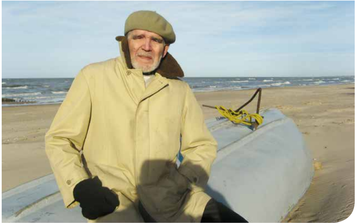
Сениор Эрикс у моря в родном Микельторнисе.

Современники и позднее исследователи ливской истории и культуры характеризуют поведение Улдрикиса в «Бунтики» как неоднозначно трактуемый ливский патриотизм, но допу-