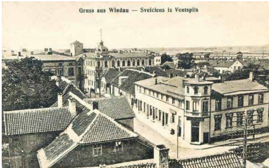
Pils un Ūdens ielas krustojums. 20. gs. pirmā desmitgade.

Laikam nekad savas pastāvēšanas vēsturē mūsu pilsēta nav augusi, pletusies plašumā un augstumā tik strauji, kā tas notika 19./20. gs. mijā un divdesmitā gadsimta sākumā (līdz I Pasaules karam). Protams, visnotaļ iespējams, ka arī viduslaiku periodā bijuši straujas augsmes periodi, taču par tiem trūkst informācijas, arī par Kurzemes hercogistes ziedu laikiem varētu būt vairāk ziņu. Taču mazo, visnotaļ nikuļojošo Ventas krasta pilsētiņu 18. gs. un līdz 19. gs. 50.–70. gadiem ir grūti salīdzināt ar vētrainā tempā attīstošos Ventspili dažas desmitgades vēlāk. Visā pamatā, protams, ir osta un dzelzceļa līnija, kā sacītu mūsdienās, pareizs loģistikas risinājums, kas ļāva attīstīties tranzītam, vietējai rūpniecībai, materiālu apstrādei, cita veida transporta līniju un sakaru izveidei.